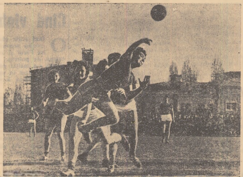
Meciurile din cadrul campionatului feminin sînesc un deosebit interes în rîndurile amatorilor de handbal. Dinamismul și spectaculozitatea acestor înfîlîri constituie un punct de atracție pentru numeroșii spectatori. În fotografie, un aspect din jocul Olimpia București—Cetatea Bucur.