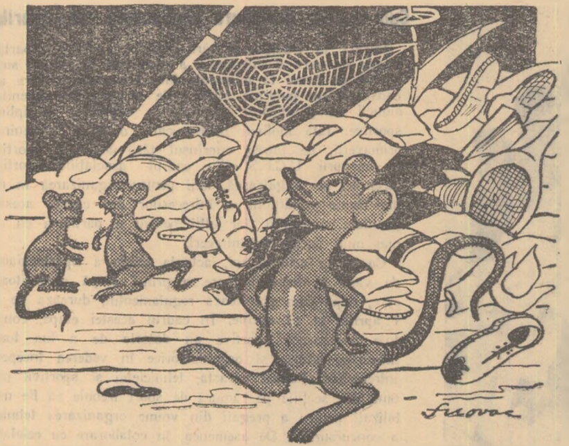
— Îi vezi? De cînd a ros bocancii echipei de fotbal a început să-și dea oare de vededă... (Desen de S. Novac)

Sînt unele asociații care nu se îngrijesc de păstrarea în bune condiții a materialului sportiv