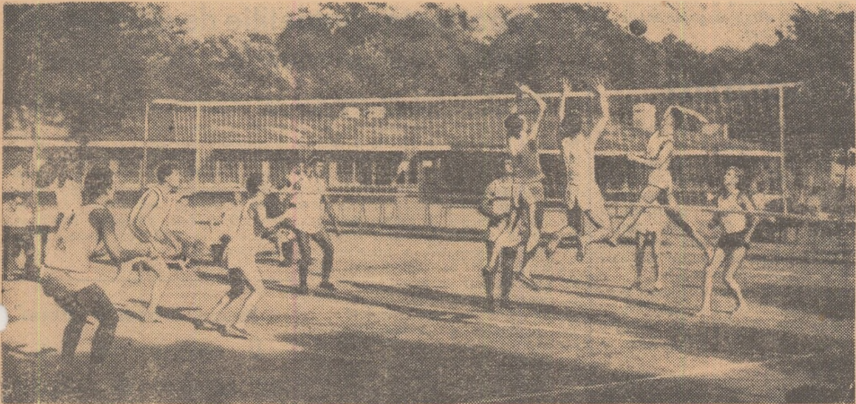
Au început întrecerile celei de a IV-a ediții a Spartachiadei de vară a tineretului. În curînd vor putea fi văzuți disputîndu-și cu ardor înîntetatea mii de alleți, înotători, cicliști, handbaliști, jucători de oină, luptători, voleibaliști, fotbaliști, popicari și trăgători.

În fotografie: aspect de la o întrecere de volei desfășurată anul trecut în Capitală.