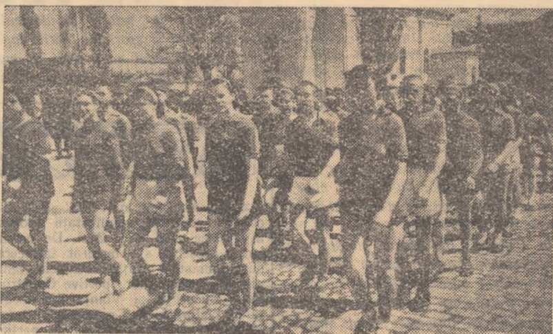
Stadionul Tineretului, baza sportivă a asociaţiei Voinţa, terenul de handbal şi sălile de sport ale complexului şcolar din Birlad, au găzduit zilele trecute frumoase întreceri organizate cu prilejul unei „duminici sportive”. Concursurile au angrenat peste 700 sportivi din regiunea Iaşi. Numai la atletism au luat startul mai mult de 250 sportivi din toate raioanele regiunii.

Fotografia de sus reprezintă defilarea coloanei de sportivi a asociaţiei „Unirea” Birlad, iar cea de jos o fază din meciul de rugbi Constructorul Birlad — C.C.A. terminat cu victoria militarilor la scorul de 18-0.