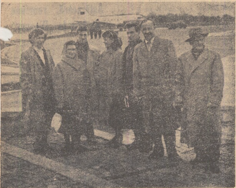
Lotul sportivilor sovietici la sosirea în Capitală pe aeroportul Băneasa

În aceste zile, la Federația română de gimnastică a domnit o mare animație: s-au făcut ultimele pregătiri în vederea celei de a II-a ediții a campionatelor internaționale de gimnastică ale țării noastre. Sala Floreasca, înbrăcată în haină de sărbătoare, își așteaptă și ea oaspeții. Peste tot flutură stegulețele multicolore.