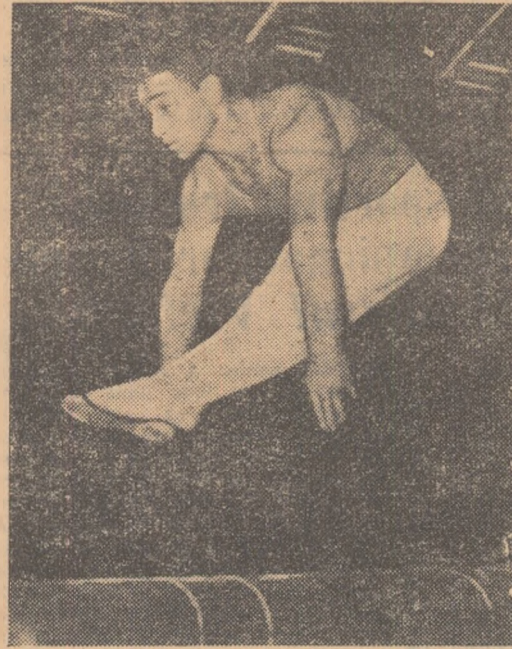
Au început întrecerile campionatelor internaționale de gimnastică ale R.P.R. Iată o primă imagine de la concurs: o spectaculoasă săritură la cal.

Primul pas... va fi făcut în aceste zile cînd va începe campionatul de fotbal al asociației. La această întrecere și-au arătat participarea 22 de echipe reprezentînd diferite sectoare de producție. Un fapt demn de subliniat e acela că unele sectoare de producție vor fi reprezentate de una sau mai multe echipe, ceea ce scoate în evidență și mai mult succesul de care s-a bucurat acest gen de întreceri sportive. Să ne oprim ceva mai mult asupra acestui campionat de fotbal. Să vedem cum a fost el organizat și cum