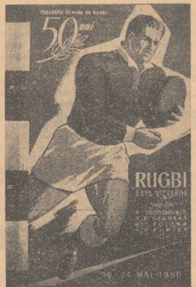
RUGBI ERA VICTORIE

etape marchează, de altfel, un frumos reviriment calitativ. Se observă tendința orientării către un joc deschis. Se cuvin a fi