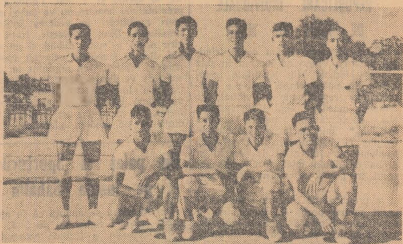
Echipa de volei a R. D. Vietnam va susține anul acesta numeroase întilniri internaționale

Întrecerile cu sportivii din celelalte țări ale lagărului socialismului au permis tineretului vietnamez să-și în-