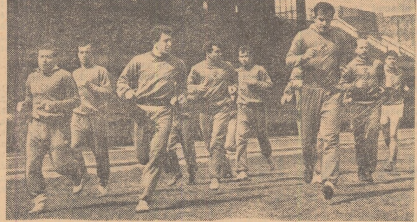
Imagine din cursul unui antrenament al fotbaliștilor turci

Selecționabilii turci se pregătesc de multă vreme. Lotul a făcut câteva an- trenamente comune între etapele de campionat. Aici, la începutul anului s-a încheiat campionatul ligii profesio- niste Istanbul și imediat a început