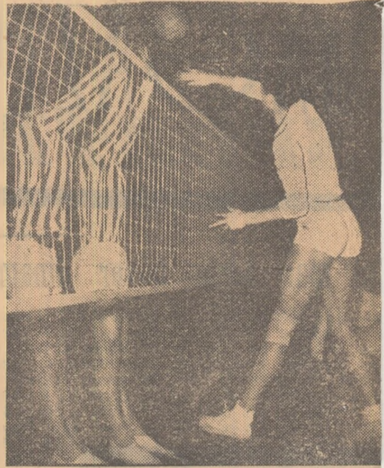
Voleibaliștii romîni și-au început activitatea internațională pe anul acesta odată cu jocurile internaționale din cadrul „Cupei 16 Februarie”. Fotografia noastră reprezintă o fază din meciul Cetatea Bucur — Lokomotiv Praga.

Mîine se dispută ultima etapă a campionatului feminin de volei pe 1956-1959. Deoarece echipa campioană se cunoaște de pe acum (formația Rapid București), interesează în special lupta pentru evitarea jocului IX, supus retrogradării. „Concurează” formațiile Progresul București și Știința Cluj. Pentru a scăpa de retrogradare, Progresul are nevoie de victorie în fața formației Dinamo București. În acest caz va decide setaverajul dintre Progresul și Știința