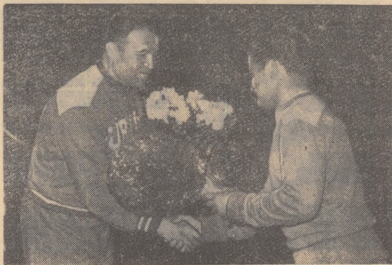
Audrenorii celor două echipe schimbă janiioanele inaintea inceperii intîlnirii.

Întîlnirea s-a bucurat de un frumos succes. Halterofili români au avut ocazia să-și verifice pregătirea, în timp ce oaspeții — așa după cum ei