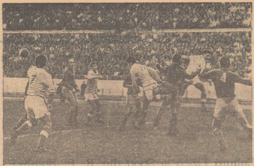
În fotografie, un aspect din meciul C.C.A. — U.T.A. disputat în toamnă. Vor reuși arădenii să reediteze duminică, în jocul cu Dinamo, frumoasa comportare pe care au avut-o în acest meci?

Lupta continuă la „B” ...și încă mult mai pasionant după rezultatele etapei de duminică trecută, etapă care s-a caracterizat prin numeroase surprize. Duminică aceasta, echipele frunțate susțin din nou partide dificile: Minerul Lupeni-Tractorul Or. Stalin, C.S. Tg. Mureș-C.S.M. Reșița, Gaz Metan Medias-C.S.M. Baia Mare, Rulmentul Birlad-Tarom București, Metalul Titanii-Unirea Focșani, Unirea Iași-Gloria Bistrița. La „C” trei lideri (CFR Pașcani, SNM Constanța, CSU București) joacă acasă, iar ceilalți trei (Carpați Sinaia, Rapid Cluj și Metalul Oțelul Roșu) în deplasare.