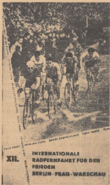
XII. INTERNATIONALE RADPERNFART FÜR DEN FRIEDEN BERLIN - PRAG - WARSCHAU

Echipe: 1948: ambele curse R.P.F. Iugoslavia; 1949: Franța; 1950: R. Cehoslovacă; 1951: R. Cehoslovacă; 1952: Anglia; 1953: R.D. Germană; 1954: R. Cehoslovacă; 1955: R. Cehoslovacă; 1956: Uniunea Sovietică; 1957: R.D. Germană; 1958: Uniunea Sovietică.