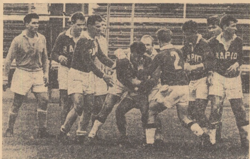
Jucătorii Rapidului au jucat mai organizat și firește au învins. Fază din întîlnirea de rugbi dintre Rapid și Progresul din „Cupa R.P.R.” (9—3).

În concluzie, problema acompaniamentului muzical trebuie să constituie o preocupare importantă pentru gimnaste și antrenori, datorită faptului că el ocupă un loc însemnat în aprecierea generală a exercițiului. I. GY.