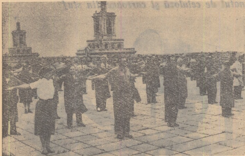
Tineri și viștrici, muncitorii secției zețării de la „Casa Științei” execută cu plăcere și conștiințiozitate exercițiile gimnasticii de producție.