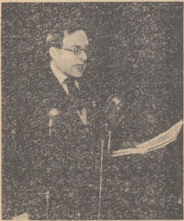
Ivor Montagu rostind cuvântul de deschidere la cea de a XX-a ediție a campionatelor mondiale de tenis de masă, desfășurată în 1953 la București în sala Floreasca.

Opinia publică mondială a luat cunoștință, la sfârșitul săptămânii trecute, de decernarea Premiilor Internaționale Lenin „Pentru întărirea păcii între popoare“. Printre noii laureați se află și cunoscutul publicist englez și militant al luptei pentru pace Ivor Montagu, membru al Biroului Consiliului Mondial al Păcii, Pentru iubitorii de sport, numele lui Montagu este legat însă și de activitatea pe care acesta o duce de ani de zile ca președinte al Federației internaționale de tenis de masă. Ivor Montagu este un adevărat pionier al acestui sport atât de popular în zilele noastre. El conduce forul suprem al tenisului de masă încă din 1926, de la înființarea acestuia.