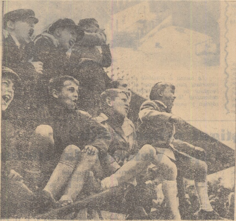
Tribunele par a fi neîncăpătoare pentru micii suporteri „rejugiați” pe scara cronometrajelor. Înnoșii, spectatori și-au susținut cu mult entuziasm, — în toate fazele de atac, — echipa lor favorită — reprezentativa de fotbal a școlii medii Nr. 12.