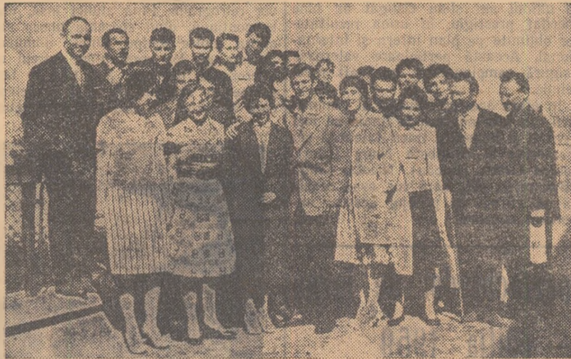
Sportivii francezi, la câteva minute după aterizarea avionului.

In drum spre Constanța, unde-i așteaptă meciurile cu reprezentativele orașului București, voleibaliștii și voleibalistele din echipele Parisului s-au oprit câteva ore în Capitală, ieri după amiază.