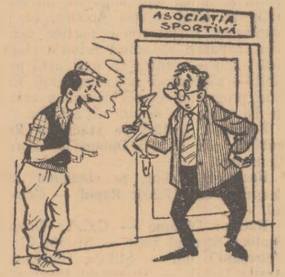
INTRE MEMBRII ASOCIAȚIEI SPORTIVE

Dar ce s-a întreprins pentru ca sportivii fruntași să poată urma cursurile de instructori sau arbitri? Datorită lipsei de interes și a unei munci superficiale rezultatele sint necorespunzătoare. Nu e de mirare deci că secțiile de atletism, volei, baschet, tenis de masă, șah n-au nici o activitate și trăiesc numai în... dosarele asociației. Nu e de mirare că secția de gimnastică s-a desființat, iar în sala de sport comitetul de întreprindere permite să se dea reuniuni. Nu e de mirare că președintele asociației n-a auzit de concursul „Cel mai bun sportiv din 10“, că nu s-au organizat întrecerile crosului „Să întimpinăm „1 Mai“. Echipele de handbal sint și ele pe cale de a se destrăma. Ce e răspund de munca sportivă au neglijat pină și stringerea cotizației sportive. Din cei 6000 lei cît trebuia să se strîngă pe trim. I s-a realizat numai 1400. Deci doar un procentaj de 23%.