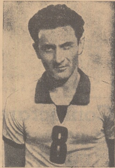
Ass (Dinamo Moscova)

DINAMO BERLIN—M.S.P. (R.P. CHINEZA) 3—2 (15—17, 16—14, 9—15, 15—2, 15—12). Și acest meci a purtat amprenta partidelor hoțărtoare: cine cișliga se califică în tur-