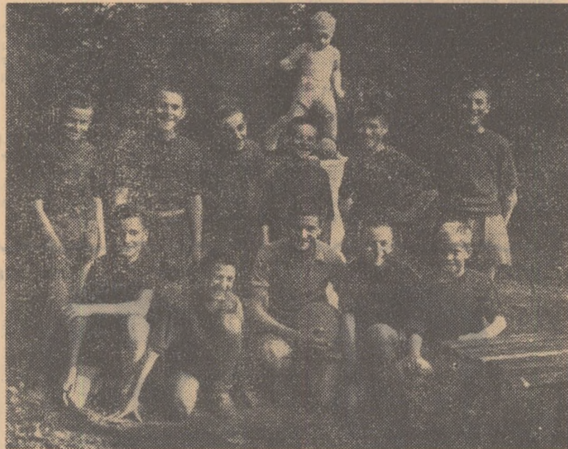
Una din echipele de fotbal ale pionierilor