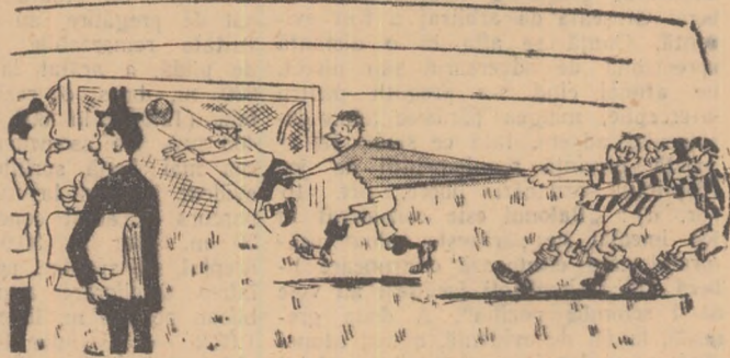
— Avantajul nostru nostru țesături este că toată lumea poate să tragă: atacantul trage la ocazie și apărătorii trag de atacant. (Desen de FRED. GHENADESCU)

Unii jucători de fotbal, neștiind cum să-și mai oprească adversarii, recurg la mijloace nepermise.