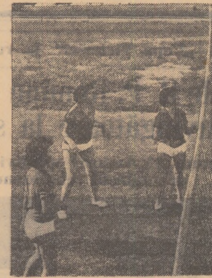
La Casa de Cultură a Tineretului din raionul Nicolae Bălcescu se desfășoară o activitate sportivă foarte susținută. În fotografie, un grup de tineri de la fabrica textilă „Pavel Tcacenco” în timpul unei partide de volei.

ÎN CENTRUL VIETII SPORTIVE A CARTIERULUI — Tovarășe profesor, înscrieți-mă și pe mine. Aș vrea să joc handbal!