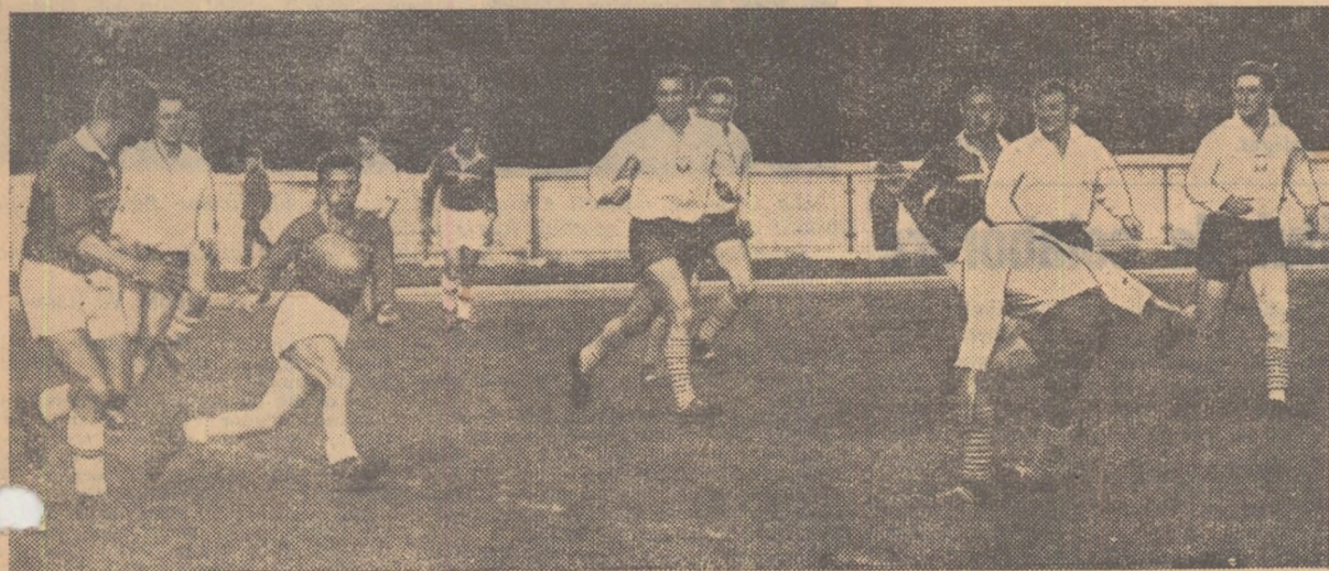
Fază din meciul R.P. Română—R.P. Polonă: unul din numeroasele atacuri ale echipei noastre reprezentative.

Miine, pe stadionul „23 August“ sportivii români îi întâlnesc pe rugbiștii cehoslovaci