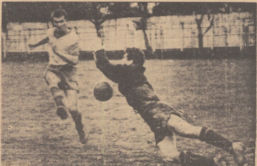
Barta, portarul echipei constănțene reține nugea printr-un plonjon spectaculos din fața lui Apostol (Dinamo 9 Miliție). (Fază din întîlnirea de categorie C Dinamo 9 Miliție București-S.N.M. Constanța).

● Doi ilderi au fost ajunși (C.F.R. Pașcani și Metalul Ojeluș Roșu), iar unul întrecut (Carpați Sîmbia) ● S.N.M. Constanța continuă să aibă emoții ● Jocuri viu disputate în etapa de duminică ● Jucători nedisciplinați asupra sancționați de federație