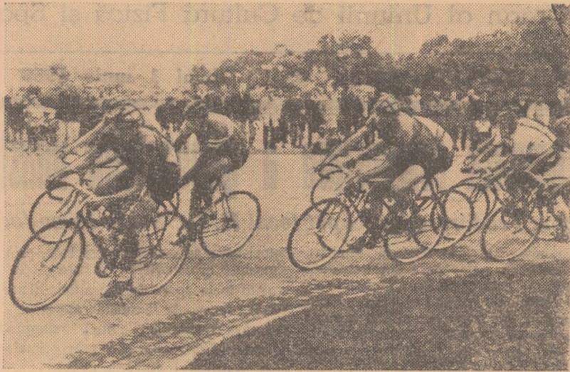
La turanța din fața stadionului „23 August” plutonul seniorilor se menține compact la cea de a 37-a tură.