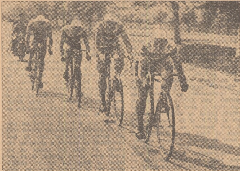
Schimbându-se cu rîndul la conducerea micului pluton, cicliștii pedalează puternic pentru realizarea unui timp cât mai bun în campionatul republican de semi-fond pe echipe.

Performanța dinamoviștilor nu este însă singura C.C.A. I (2 h. 24:51), Victoria I (2 h. 27:24), C.C.A. II (2 h.