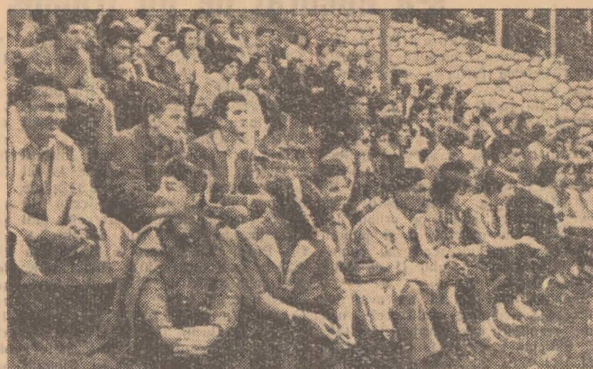
Un grup din cei peste 400 școlari bucureșteni care s-au deplasat la Poiana Stalin, asistă din tribuna stadionului de la poalele Postăvarului, la partida de handbal.

— Nu, n-am oboșit tovarășe profesor și... nici nu v-am rugat să-mi