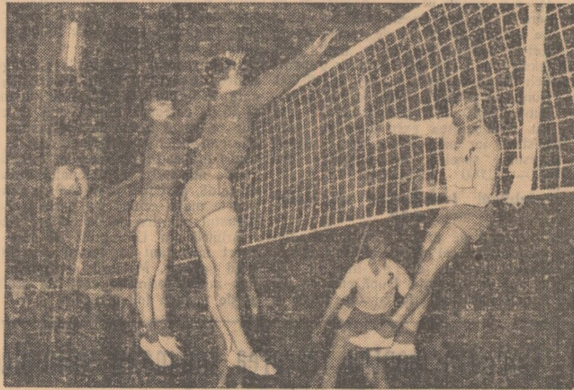
Roman în plină acțiune. Blocajul francezilor Bertagnol și Courtin se dovedește a fi ineficace în fața impetuozității căpitanului reprezentativei orașului București (Fază din meciul București — Paris 3-0).

După două victorii care dădeau speranțe, înfrângerea categorică (0-3) a dinamovistelor în fața jucătoarelor de la Dinamo Moscova a afectat pe iubitorii voleiului. Aceasta din două motive: în primul rând pentru că echipa a fost alcătuită din jucătoare cu o bogată experiență internațională și în al doilea rând, pentru că valoarea reală a invinselor e cu totul altă, mult mai ridicată. E drept că și echipa oaspe a jucat excelent, făcând în partida cu Dinamo București o adevărată demonstrație de volei.