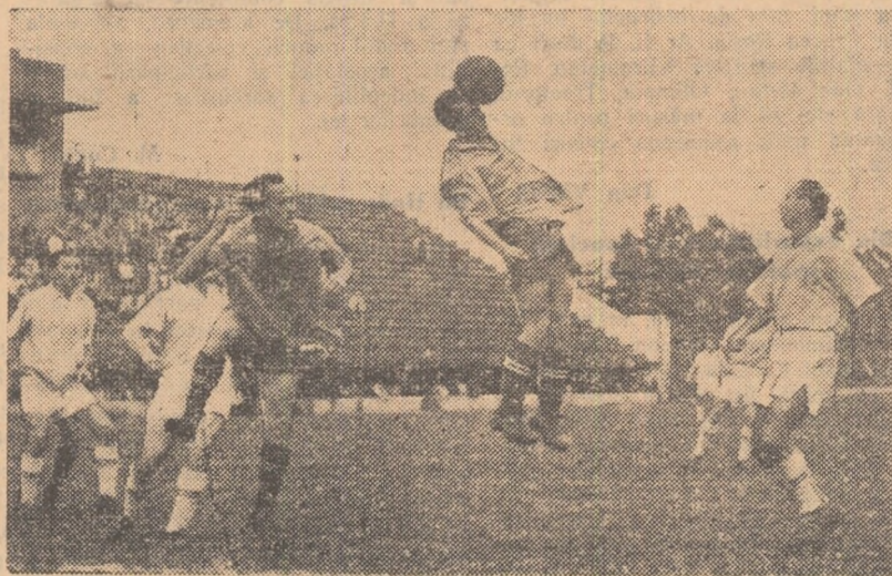
Apărătorii echipei din Fălticeni resping un atac al Aram-ului (Fotă de la întîlnirea Aram — Foresta Fălticeni).