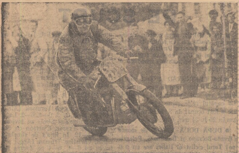
Imagine de la prima fază a campionatului republican de viteză pe circuit desfășurată la Cimpina.

66,66 m. spate: L. Berca (Dinamo) 50,4; 100 m. spate: M. Cerchez (C.C.A.) 1:20,5; 33,33 m. bras: G. Malareine (Cl. șc.) 28,3; 66,66 m. bras: C. Radulescu (Cl. șc.) 57,1; 100 m. bras: V. Percea (Cet. Bucur) 1:25,4; 33,33 m. fluture: M. Zager (Cl. șc.) 23,3; 66,66 m. fluture: L. Berca (Dinamo) 56,2; 100 m. fluture: N. Burdujea (C.C.A.) 1:21,9; fete: 33,33 m. liber: Irina Damian (Cl. șc.) 25,6; 66,66 m. liber: Anca Trohani