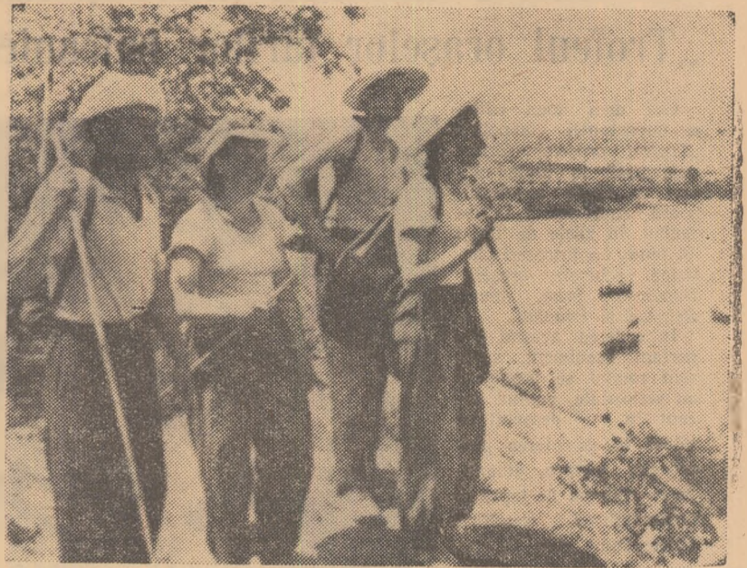
O dată cu venirea zilelor calde, a început sezonul de turism în U.R.S.S. Iată un grup de tineri în împrejurimile pitorești ale orașului Krasnodar.

Ar părea poate ciudat, dar tînărul mare maestru Boris Spasski, care a concurat de mai multe ori la titlul de campion al U.R.S.S., a participat