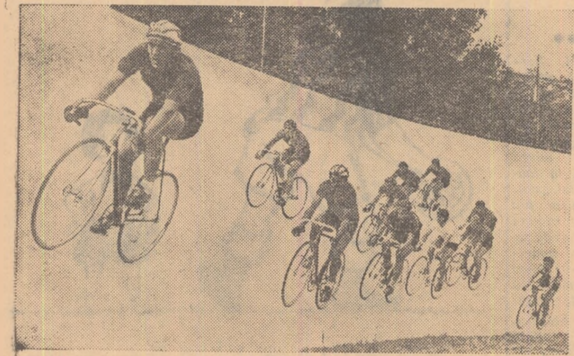
Fază din desfășurarea unei curse de semifond pe velodrom

Între 11 și 14 iunie va avea loc a V-a ediție a „Cursei Munților”, întrecere de fond pe etape organizată de clubul sportiv Dinamo București. Ca în fiecare an, această competiție stîrnește un viu interes în rîndul rutierilor și al iubitorilor sportului cu pedale. Startul în cea de a V-a ediție se va da la 11 iunie de la Sinaia, urmînd ca sosirea să se facă la 14 iunie pe velodromul Dinamo. La 7 V-a ediție a „Cursei Munților” participă și echipele Dozsa Budapesta și Dynamo Berlin.