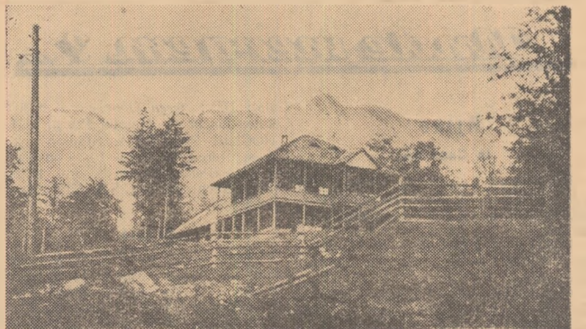
Cabana Izvorul Muntelui

La distanțe relativ mici de oraș se găsesc uzine de fibre sintetice de la Săvinești, marele șantier al hidrocentralei „V. I. Lenin” de la Bîraz, fabrici