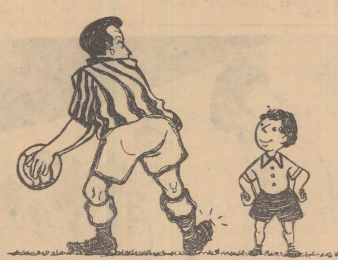
Puștiul: — Nene, lasă-mă să-l trag eu (Desen de V. Vasiliu)