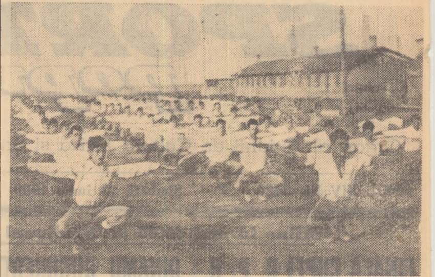
Brigadierii de pe șantierul Combinatului de Celuloză Chișcani execută programul de gimnastică.

Chiar din primele zile după înființarea brigăzilor de tineret de pe șantierul Combinatului de Celuloză de la Chișcani, în programul de activitate zilnică al acestor unități de muncă a fost introdusă și gimnastica de producție. În fiecare dimineață, înainte de a porni spre sectoarele de muncă, tinerii brigadierii execută un program de gimnastică de angrenare. Vestea că brigăzile de muncă își încep activitatea zilnică printr-un program de gimnastică de angrenare s-a răspîndit pe tot șantierul, iar această acțiune a fost privită de