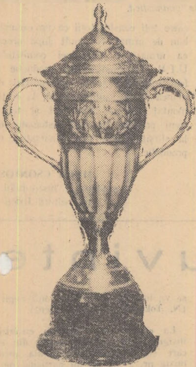
CUI II VA REVENI MIINE?..

(Material primit în cadrul concursului „Pentru cea mai bună corespondență“)