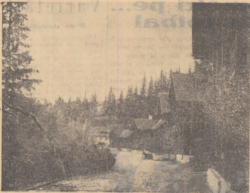
Păliniș, una dintre stațiunile cele mai vizitate de excursioniștii din Sibiu își așteaptă oaspeții. Iată în fotografie câteva case de odihnă de la Păliniș.