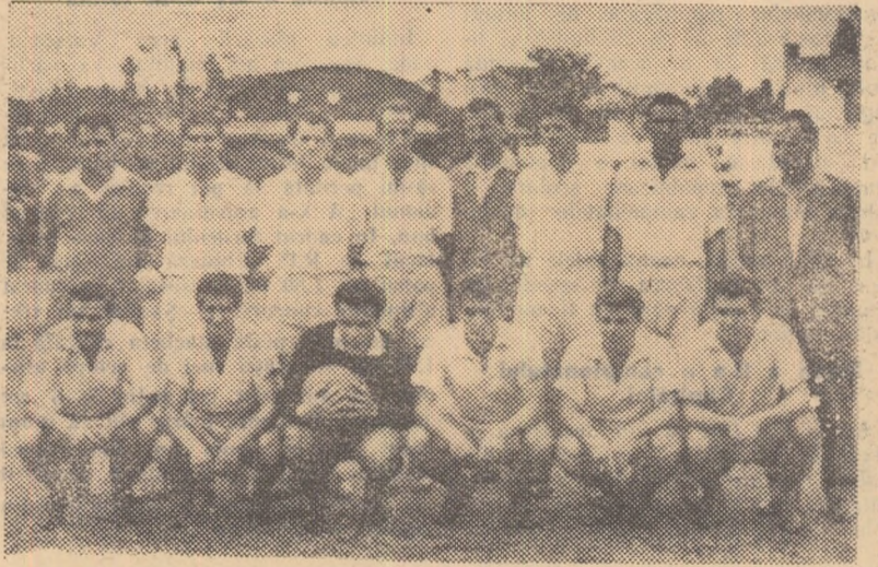
Petrolul Ploesti (antrenori: I. Oană și Fl. Fătu) a cucerit pentru a doua oară consecutiv campionatul republican și va reprezenta țara din nou în „Cupa Campionilor Europeni”.

Cum a ajuns Dinamo în finală? 4-0 cu Raf. 4. Cimpina, 1-0 cu U.T.A., 3-1 cu C.C.A. și 5-3 cu Rapid.