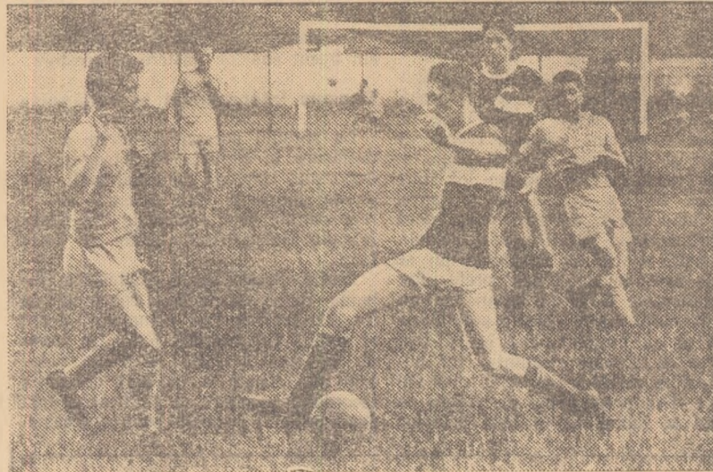
Fază din meciul de fotbal, în care s-au întâlnit cele două echipe campioane ale etapei pe asociație la Spartachiada de la uzinele „Tudor Vladimirescu” și de la întreprinderea „Adesgo”.

Creale în anii regimului democratic popular, uzinele „Tudor Vladimirescu” din Capitală sînt azi o mîndrie a industriei noastre socialiste. Autobuzele produse de aceste uzine străbat în lung și în lat țara, iar elegantele și confortabilele troleibuze deservește transpor-