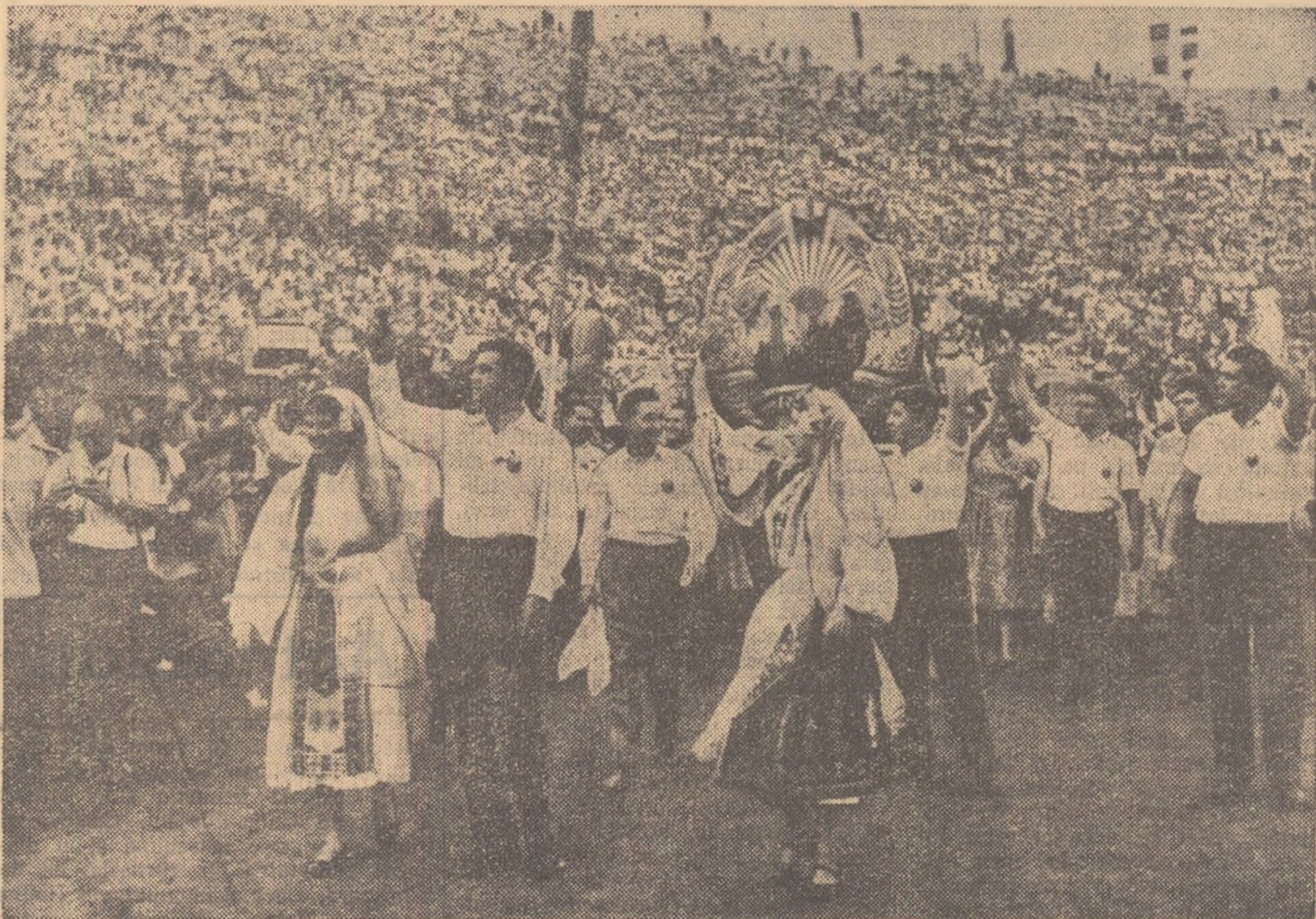
Delegația tineretului din R. P. Română la deschiderea Festivalului de la Viena.

● BASCHETBALIȘTII NOȘTRI INVINGATORI ÎN MECIUL CU R. P. BULGARIA ● URIAȘ INTERES FAȚA DE TURNEELE DE BOX ȘI FOTBAL ● SPORTIVI DE VALOARE MONDIALA IAU PARTE LA CONCURSUL DE ATLETISM ● TINERII REPREZANTANȚI AI R. P. CHINEZE AU DOMINAT ÎNTREGERILE DE TENIS DE MASA