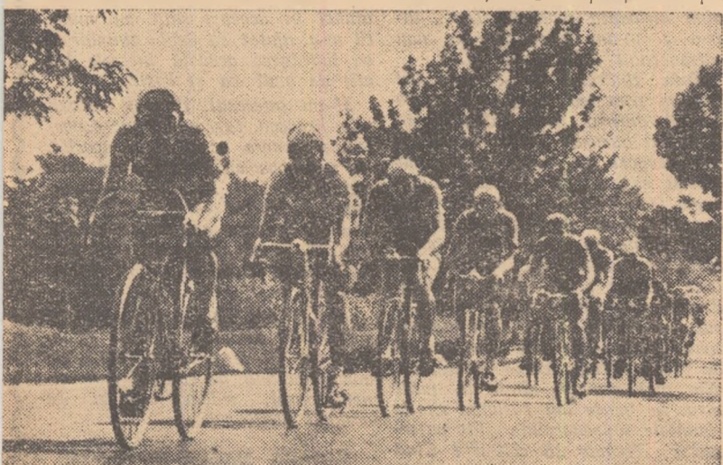
Cicliștii străbat traseul primei etape din „Cursa Științei”. În fotografie, plutonul mare de alergători în apropierea orașului Ploiești.

● ÎNȚILNIREA DE POLO PE APA dintre primele reprezentative ale R.P. Ungare și R. D. Germane a fost cîștigată de sportivii maghiari cu 4—1 (3—0).