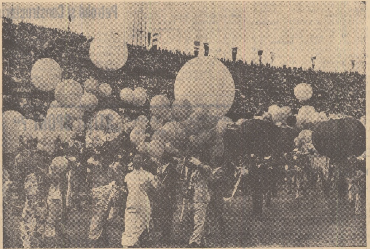
Un aspect de la marea sărbătoare a tineretului lumii, cel de al VII-lea Festival Mondial. Prin fața tribunelor trece delegația bravului tineret din China Populară.