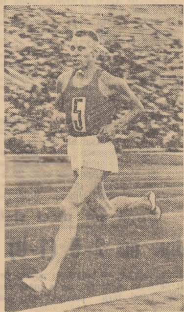
Petr Bolotnikov a realizat în cadrul Spartachiadei popoarelor cel mai bun timp mondial al sezonului în proba de 10.000 m — 29:03,0. El a câștigat și proba de 5.000 m.

Îată câteva din ultimele rezultate: ATLETISM: 5.000 m — Bolotnikov 13:52,8; 1.500 m — Pipine 3:45,9; suliță — Tibulenko 76,89 m, maraton — Popov 2h 21:54,0; suliță femei — Zlatagaitite 53,64 m.