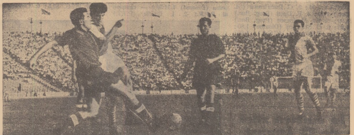
Aspect din meciul Petrolul — Progresul, Soare în luptă pentru balon cu Dridea, Caricaș, Babone și A. Munteanu asistă la duelul lor.