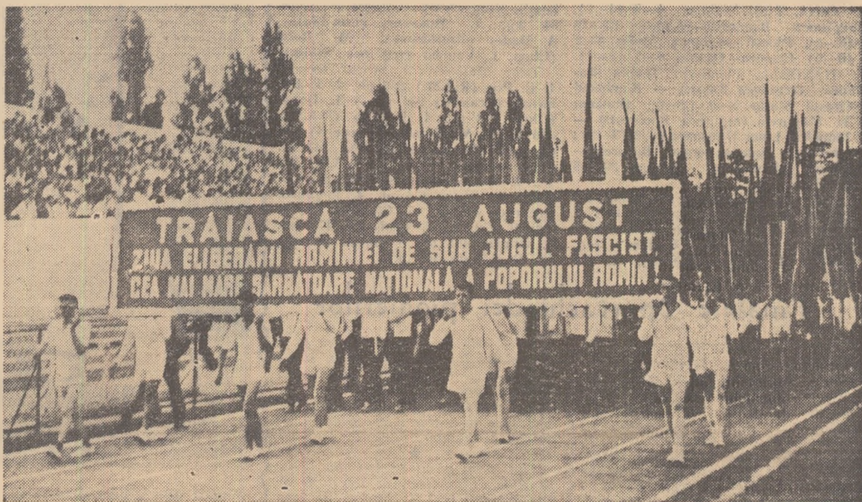
Aspect de la deschiderea festivă a întrecerilor.

● Deschiderea festivă a Spartachiadei pionierilor și a celei de a IV-a ediții a Spartachiadei de vară a tineretului ● Peste 3.000 de participanți ● Au început întrecerile