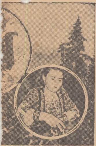
noastre au un nou și drag vase participă în fiecare an săteni

Pe mîla de terenuri, fotbalul — sportul cel mai popular — aduce în tribune neamărați spectatori, triplăcărâși susținători ai sportului cu balonul rotund.