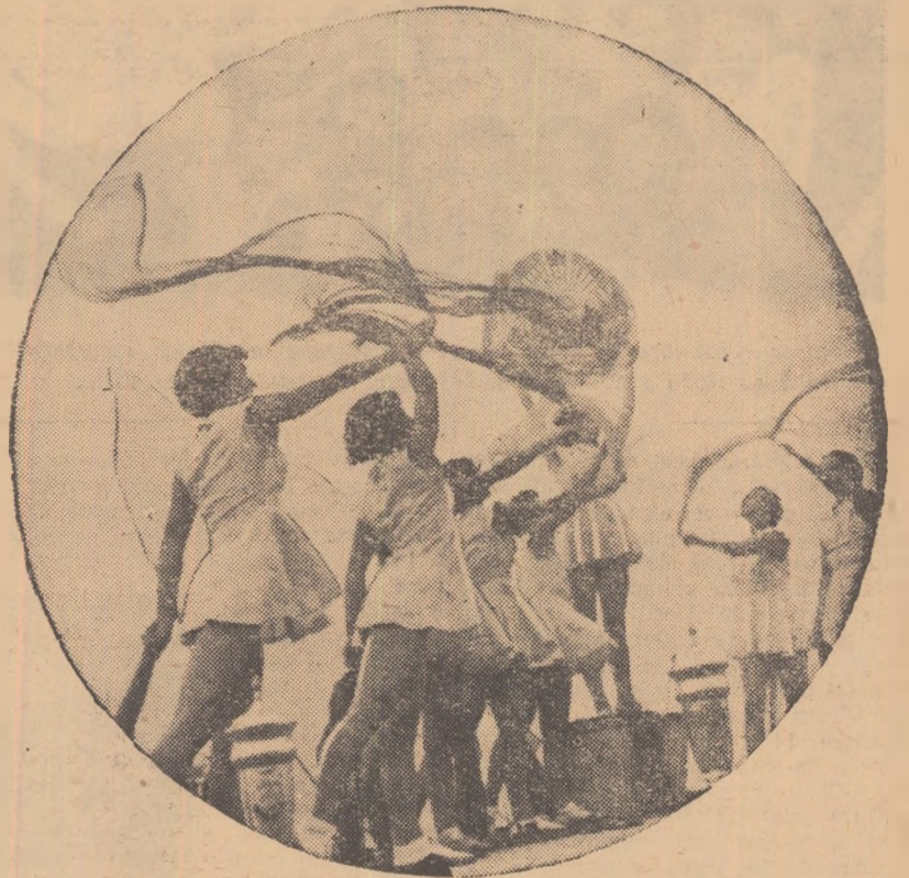
Peste 450.000 femei fac astăzi sport. Aceasta este, fără îndoială, o cucerire de preț a sportului nostru nou.