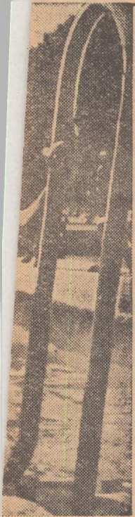
În acești ani în- rîndul lor se îmbrăci.