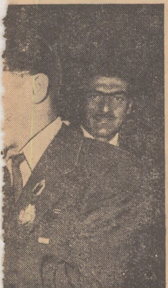
identă pe fețele celor doi cam- — este întregită de înalta apre- al-popular. Ei au primit — ca — Ordinul Muncii.