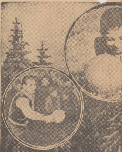
Oamenii muncii din satele patriei prieten: sportul. La întrecerile de muncă aproape 1.000