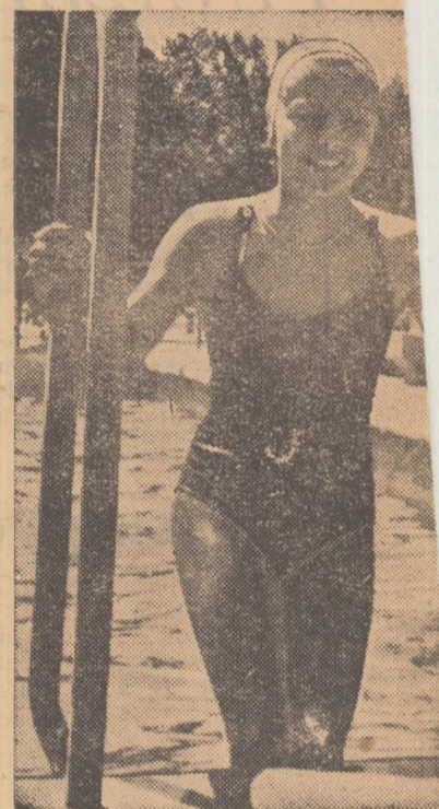
În numeroasele bazine construite în țară înotul mii și mii de copii. Dintr-o ridică apoi viitorii campioni și recorduri

...Racolaj, profesionalism, lupte acerbe de culise, afaceri odioase, naționalism șovin, exploatare — acesta era sportul de ieri. Viața sportivului sfîrșea o dată cu cariera sa sportivă. Priviți facsimilele! Ele vorbesc elocvent despre sportul de ieri! Dar cîte alte lucruri odioase, murdare, care scot în evidență racilele sportului capitalist n-au fost ascunse poporului? Acesta însă, luminat de partid, a pornit la luptă și apoi zdrobind jugul exploatării, a înlăturat chiquitoarea ocîrmuire capitalistă și sub conducerea gloriosului partid al comuniștilor și a făurit o viață nouă.