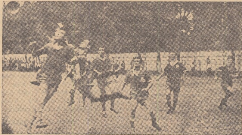
Un buchet de jucători își dispută mîngea. Fază de la întîlnirea de fotbal Dinamo Miliție București — Știința Craiova (1-0)

Săptămîna trecută a avut loc la Belgrad întîlnirea de atletism dintre echipele Iugoslaviei și Franței. Așa cum am mai anunțat, victoria a re-