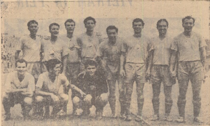
Imediat după terminarea meciului, fotbalistii noștri, plini de bucurie, surd obiectivului aparatului de fotografiat.

An reținut și unele lipsuri. După un gol marcat echipa noastră a slăbit ofensiv, jucînd uneori nesigur, în linii dual, dînd posibilitatea adversarului să inițieze. Nu întotdeauna stăpînea centrul terenului cu înțelegere și mijloacii, ceea ce ducea la pierde-