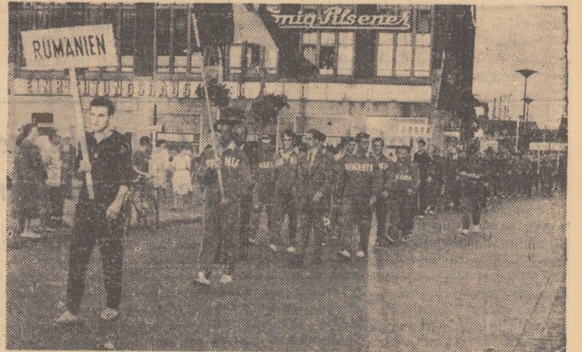
Aspect de la defilarea canotorilor participanți la campionatul european de la Duisburg

— Sportivii maghiari au dominat „europenele” — Un eșec al canotorilor din occident — Organizarea a lăsat de dorit