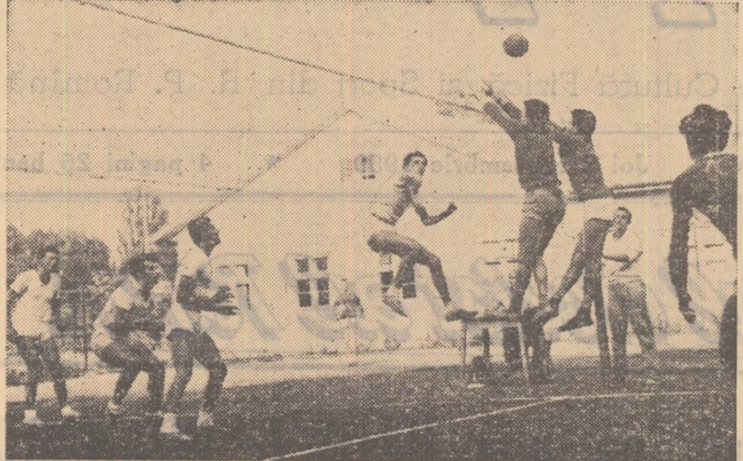
Utilajul Petrosani și Știința Galați s-au arătat demne de categoria A. Iată, în fotografie, un moment din această partidă, care a revenit Utilajului (tricouri de culoare închisă) cu 3-1.