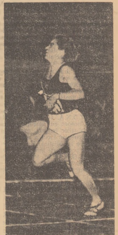
buna alergătoare a țării pe 400 m și a doua pe distanța de 200 m.

La cea de a doua Spartachiadă a Popoarelor din U.R.S.S., Itkina a de-mostrat că este și astăzi cea mai