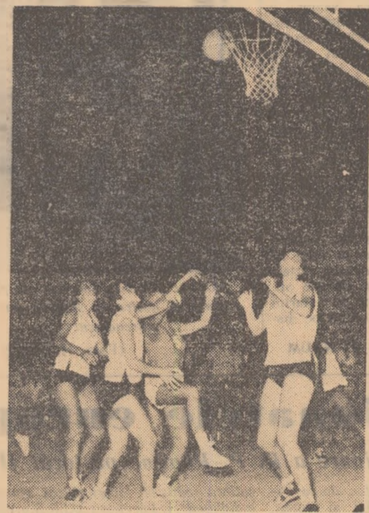
Fază din întîlnirea dintre reprezentativele R. P. Bulgaria—Franța. Se poate observa buna organiza-re a triunghiului de săritură pentru recupe-rare efectuat de echipa bulgară (în alb)

Italia a prezentat o formație în care pe lângă baschetbaliste experimentate ca Ronchetti și Vendrame au apărut nume noi, jucătoare cu talie înaltă și