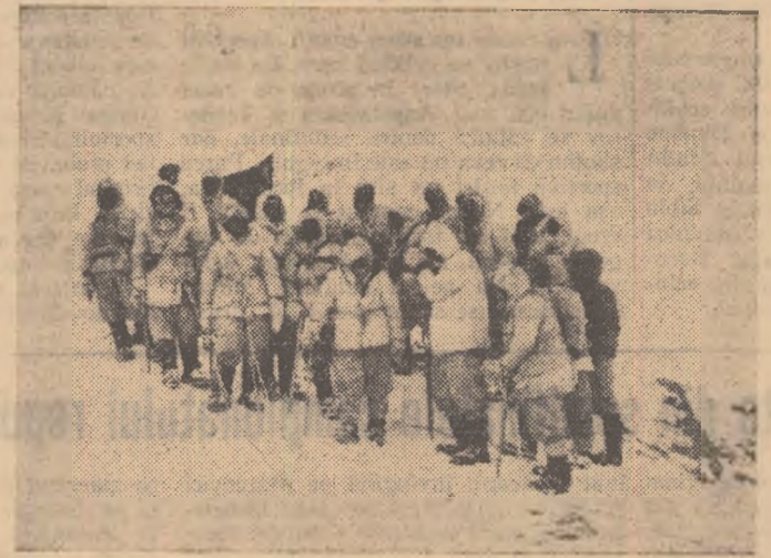
Pe virful Muztagh Ata