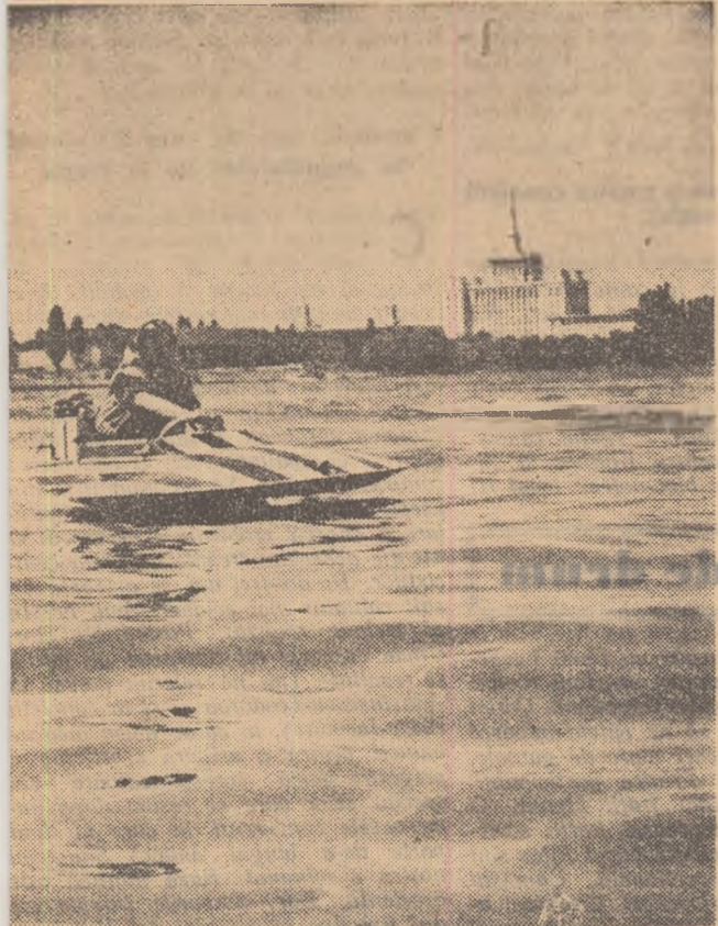
Pe lacul Herastrău