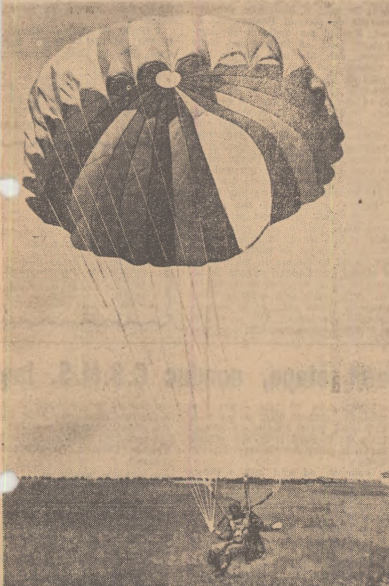
Parașutismul a devenit un sport al masei în zilele noastre. Iată un îndrăzneț stăpîn al aerului coborînd din albastrul înălțimilor...

noastră. Pun o întrebare, nici un răspuns. Toți ochii sînt ațintiți spre azurul înălțimilor.