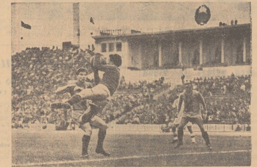
Voinescu prinde spectaculos, protejat de Jenei.