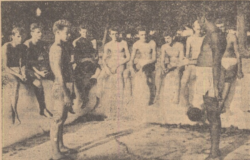
O scurtă ședință teoretică cu jucătorii de polo ai clubului Rapid București.

100 m spate masculin, 100 m spate feminin, 4x100 m mixt masculin, 4x100 m mixt feminin; polo: Rapid Buc. (juniori) — C. S. Sleza Wroclaw (juniori). Arbitrează E. Beniamin. MÂINE: 100 m liber masculin, 200 m bras feminin, 100 m fluture masculin, 200 m liber feminin, 100 m fluture feminin, 200 m bras masculin, 4x100 m liber feminin; polo: Rapid Buc. (seniori) — C. S. Sleza Wroclaw (seniori).