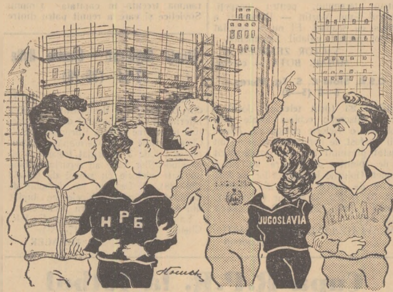
IOLANDA BALAS: Nici totul se înalță, ca și nivelul performanțelor balcanice, și se cimentează ca și legăturile de prietenie dintre sportivii țărilor noastre.