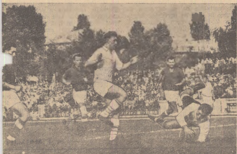
O fază palpitantă surprinsă de obiectivul fotoreporterului la meciul de categorie B Titanii București — C.S.M. Reșița (2-1): portarul bucureștean intervine în ultima instanță la o acțiune a centrului atacant reșițean Varga.