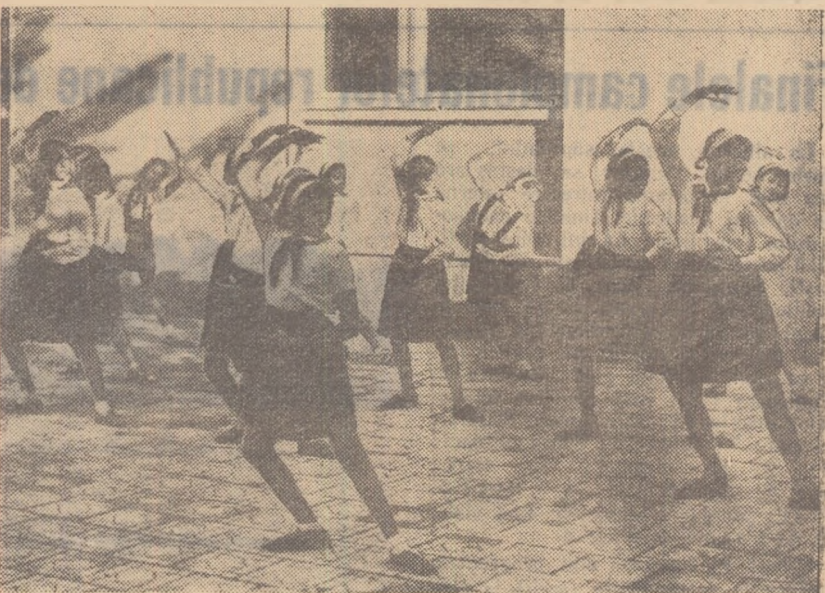
Prima oră de educație fizică... Cu grație și naturalețe, micuțele eleve din clasa a VI-a D a școlii elementare nr. 111 „Ștefan Plavă” execută un frumos exercițiu de ansamblu.