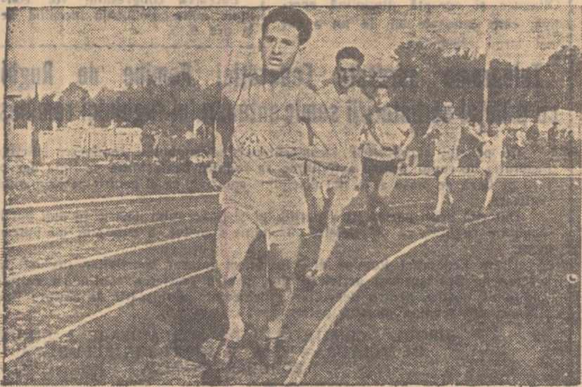
Prima ediție a „Cupei Moldovei” desfășurată anul trecut la Iași s-a bucurat de un frumos succes. Mai cu seamă întrecerile de atletism au prilejuit dispule de un rar dinamism. În fotografie, un aspect din cursa de 3000 m plat

Sportivii din regiunea Suceava, care în acest an vor găzdui finalele celei de a doua ediții a „Cupei Moldovei”, se pregătesc să dovedească că sînt nu numai gazde ospitaliere dar că prezintă o valoare în sportul Moldovei. Ei s-au pregătit din timp pentru finalele de la Cîmpulung Moldovenesc. Duminică, sportivii din regiunea Suceava își vor disputa înfrîntă în cadrul etapei regionale, care va avea loc la Dorohoi și Gura Humorului. În legătură cu finalele de