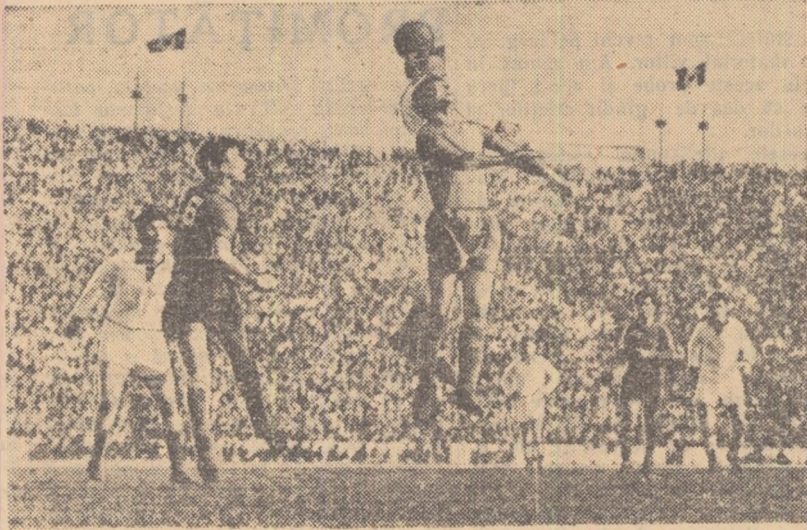
O fază din meciul Dinamo București-Progresul, disputat în primăvară, pe stadionul 23 August

Ne aflăm exact la jumătatea turului campionatului categoriei A. Miine se dispută jocurile celei de a șasea etape, dominată de întâlnirea fruntașilor clasamentului (Dinamo Bacău