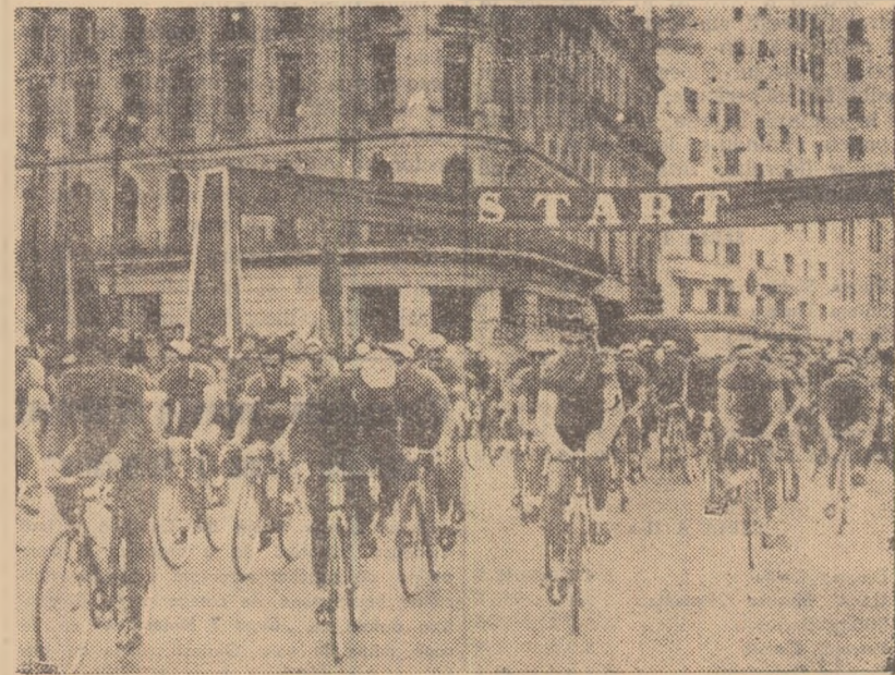
Start festiv în prima etapă a celei de a XIV-a ediții a „Cursei Victoriei”