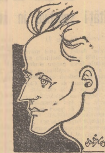
MAHEUȚA (văzută de Clenciu)

Este de la sine înțeles că cele patru jocuri de azi și mâine n-au un caracter de selecție definitivă. Ele servesc pentru a se forma o idee asupra jucătorilor care vor compune lotul unic ce se va alcătui pentru meciul cu Bulgaria. Pentru alcătuirea acestui lot, Federația a invitat la București pe toți antrenorii echipelor de categoria