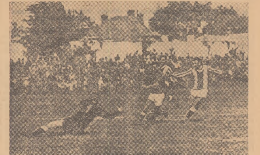
Fază din meciul de categorie B Metalul Titanii — C.F.R. Timișoara 2—1 (0—0).