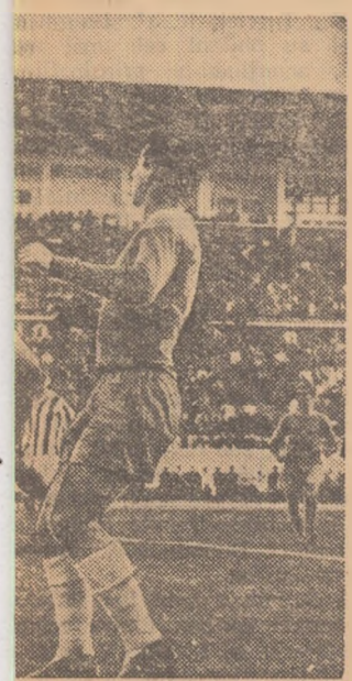
Imisă cu capul de Hașoti a a divizionară B — Diosgyöri

Reprezentativa B, a fărâșii noastre de susținut nici un meci apropiat, poate că mulți credeau că a fost scopul acestor jocuri. Răspunsul e simplu: e seama de valorile apropiate ale jucătorilor, s-a căutat în acestă să se verifice forma cîntărilor fotbalști, în vederea celor selecționări pentru în-