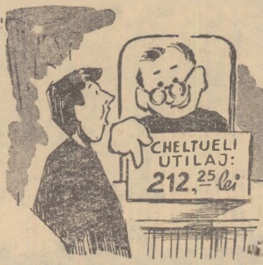
Desen de D. MIHAILA

— Dar ne-ai luat cam multe parale, să știi. Ia să mă uit și eu pe ce... Și a început să cerceteze factura: saciz 28 grame = 0,84 lei... ceară de albine 28 grame = 1,80 lei... Ață = 1,14 lei... Unsoare de piele = 4,40 lei... soluție de lipit = 0,30 lei... Camere Sighet = 234 lei... Pastile ventil = 54 lei. In total, materialele costau 296,48 bani. In regulă! După aceea urma capitolul „manopera”: 250,42 lei. Cam mulțisor! 11 lei pentru unul mingilor nu era mult de loc. Dar 168,30 lei pentru scosul camerelor din anvelope și înlocuirea lor cu altele noi pățite la capitolul materiale, ori ce s-ar spune era de-acum exagerat. Dar marea surpriză abia urma: în afară de beneficiul legal, în factură mai apărea un capitol. Și încă ce capitol! Unul de... 212,25 lei, intitulat... „cheltuieli utilaj”.