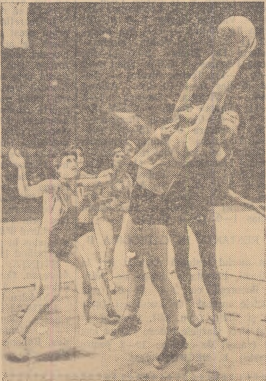
Moscova, 13 octombrie 1959. În cadrul celui de al 2-lea campionat mondial feminin de baschet de la Moscova s-a desfășurat meciul dintre echipele R. P. Romine și R. P. Polone.