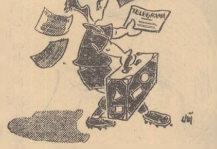
Desen de D. MIHAILA

Desigur, dragi cititori, că nimeni dintre dv. nu se așteaptă să-i