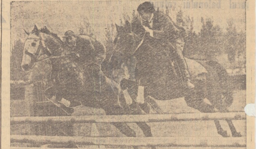
Proba de obstacole în care evoluează doi călăreți scară la scară este — după cum se poate vedea — deosebit de spectaculoasă. Asemenea probe fac parte și din programul întrecerilor de la Craiova

Așteptate cu un viu interes, întrecerile de călărie — care încep astăzi la Craiova — se anunță deosebit de spectaculoase și disputate. Cea de a doua ediție a concursului republican sătesc va reuni la start tineri țărani, reprezentînd majoritatea regiunilor țării, care se vor întrece alît în probele de plat cîr și în cele de atelaje. Numărul mare de participanți, care s-au anunțat pînă acum, și varietatea probelor inserse în program lasă să se întrevadă că vom asista la o mare demonstrație a călăriei de masă. Paralel cu acest eveniment hipic va avea loc și întîlnirea internațională triunghiulară între Recolta și echipele similare din R.P. Ungară și