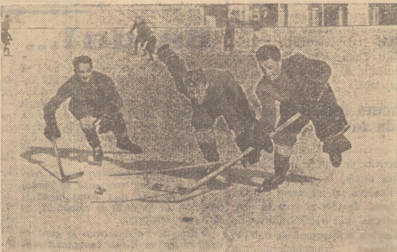
Cine va ajunge primul la puc? Unul din „gemenii” Szabo sau masivul fundaș Varga? Aspect de la antrenamentul echipei Voința M. Ciuc

● Un meci tradițional: C.C.A. — Știința Cluj ● Frumoase demonstrații de patinaj artistic ● În completarea programului — momente vesele