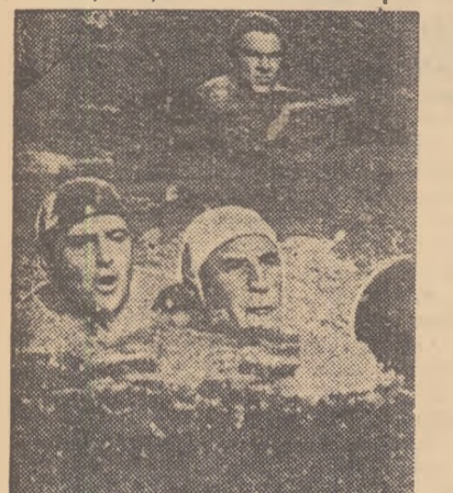
Vocac (C.S.O.) și Iosim (C.C.A.) în luptă pentru balon. Firôiu — alături în plan secundar — urmărește disputa. Fazl din meciul C.C.A.—C.S.Oradea

Echipele C.C.A. și Industria Linii din Timișoara și-au disputat partida programată inițial pentru duminică în cadrul etapei a XIII-a a campionatului categoriei A de polo. Jocul a avut loc marți la ștrandul Tineretului și s-a