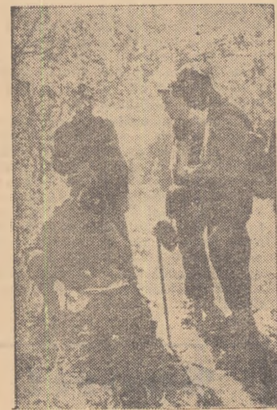
Concursurile de orientare turistică sînt tot mai răspîndite în rîndul amatorilor de drumeție. Iată, în clișeu, un as- pect dintr-o astfel de competiție

Concursul de orientare turistică des- fășurat în cinstea zilei de 7 Noiemb- re în masivul Gârbova, în organi- zarea asociației sportive Centrocoop cu sprijinul comisiei de turism din cadrul consiliului raional U.C.F.S.