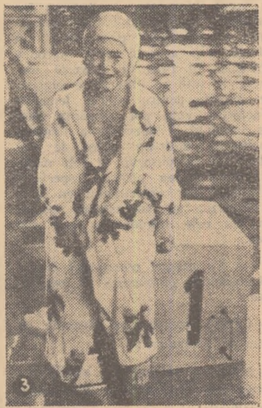
3. Astăzi cel mai mic concurent, mîine, poate, un mare recordman la înot.