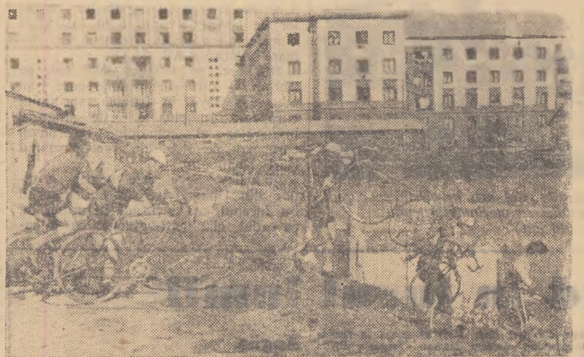
Aspect din cursa rezervată juniorilor