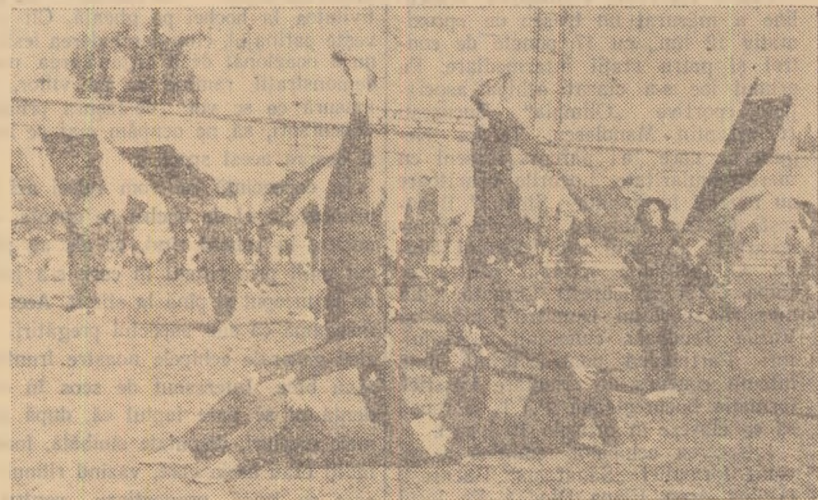
Studenții Institutului de Cultură Fizică pregătesc un frumos exercițiu de ansamblu