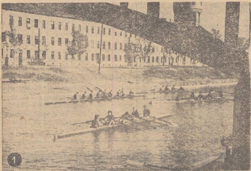
1. Canalul Bega din Timișoara a cunoscut duminică dimineața — cu prilejul desfășurării întrecerilor finale ale „Cruceiului de toamnă” la canotaj academic — o deosebită animație. Iată un grup de schifuri îndreptându-se spre start