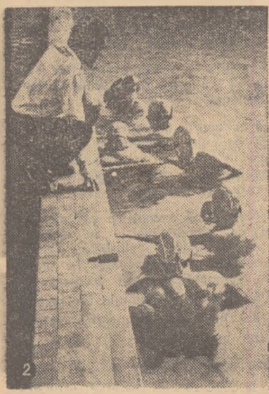
2. Înaintea meciului cu Știința Cluj, poloștii dinamoviști primesc indicații de la antrenorul lor.