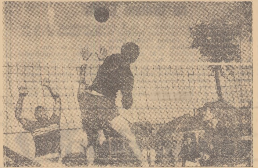
Întîlnirea de volei dintre Avîntul Beclean (Cluj) și Recolta Arpasul de jos (reg. Stalin) a fost deosebit de spectaculoasă. Ambele echipe au dovedit o mare putere de luptă. În fotografie o fază din acest meci