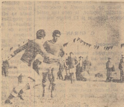
Fază din meciul de fotbal dintre echipele Recolta Diosig (reg. Oradea) și raionul Medias (reg. Stalin). Întîlnirea a fost cîștigată de reprezentanții regiunii Oradea, care au cucerit în același timp și primul loc în turneul de fotbal