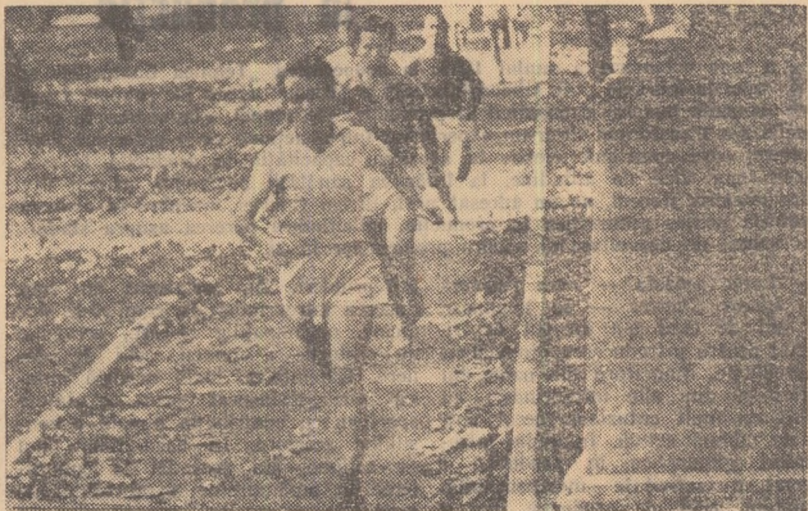
Participanții la crosul organizat duminică, de raionul V. I. Lenin, în plină cursă