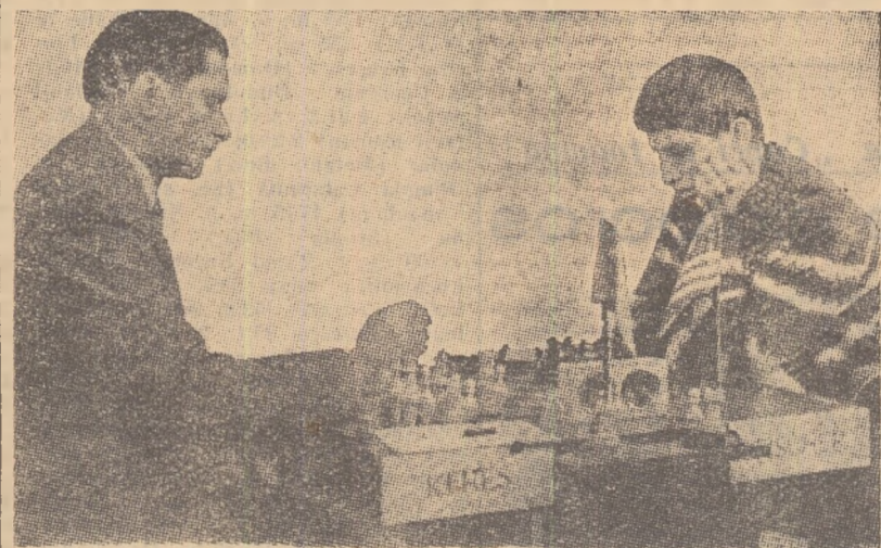
O imagine de la marele turneu al candidaților. Cel mai în vîrstă concurent, Paul Keres (43 ani) în timpul partidei cu mezinul turneului Bobby Fischer (16 ani)

Aseară s-a disputat penultima rundă în care toate partidele au fost întrerupte. Tal deține avantaj la Fischer, iar Keres are poziție cîștigată la Gligoric. Înaintea ultimei runde clasamentul este următorul: Tal 18 1/2 p (1), 2. Keres 17 1/2 p (1), 3-4. Smislov, Petrosian 14 p (1), 5. Gligoric 12 1/2 p (1), 6. Fischer 10 1/2 p (2), 7. Olafsson 9 p (2), 8. Benkő 7 p (1).