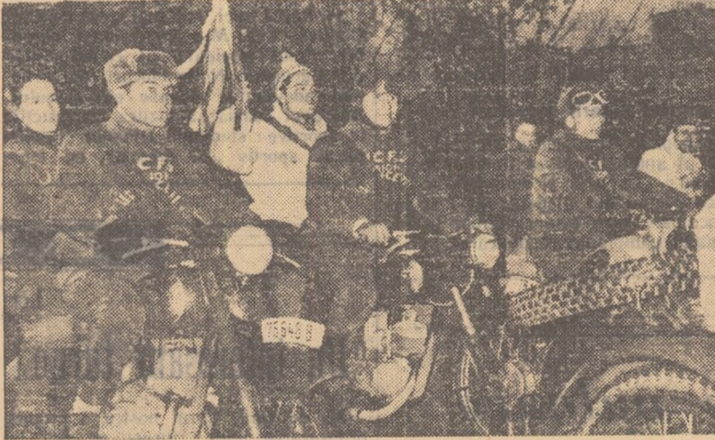
Într-o atmosferă de mare sărbătoare, marți după-amiază a avut loc în sala Dinamo din Capitală festivitatea de predare a mesajelor de salut adresate tineretului sovietic de tinerii din regiunile București, Ploiești, Pitești și din Capitală, cu prilejul celei de a 42-a aniversări a Marii Revoluții Socialiste din Octombrie. În fotografie, un grup de sportivi din regiunea București, purtând mesajul de salut al tineretului din această regiune, la câteva clipe de la sosirea pe stadionul Dinamo

...O zi mai frumoasă, așa cum ne relatează corespondenții noștri Ilie Chișar și Ion Rizoiu — Stafeta Prieteniei a ajuns în orașul Pitești. La festivitatea care a avut loc cu acest prilej a luat cuvântul tov. Gh. Turcu, președintele consiliului regional U.C.F.S. Pitești. A urmat apoi prezentarea mesajelor de salut ale sportivilor din regiunea Craiova, precum și a celor din raioanele regiunii Pitești. După ce