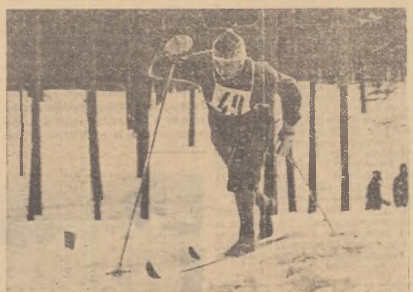
Și în acest an pârțile din munții Ukutsk de lângă Sverdlovsk vor fi loc de desfășurare a unor mari competiții ale schiorilor sovietici în pregătirea lor pentru I. O. de iarnă