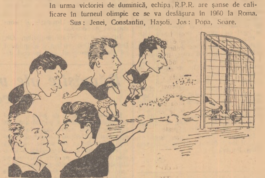
Soare: „Toate drumurile duc la Roma, dar acesta e cel mai sigur!”

Etapa cu care se reia campionatul programează câteva meciuri de mare importanță pentru clasament. Pe primul plan se situează înfrîngerea dintre C.C.A. și UTA, un meci care promite să ofere un spectacol fotbalistic de cali-fitate. Nu mai puțin interesante vor fi meciurile Petrolul Ploiești—Rapid Bucu-rești și Farul Constanța—Dinamo Bacău, cărora echipele respective le acordă o deosebită importanță. Steagul roșu O-rașul Stalin va juca cu Știința Cluj o partidă deosebit de înmortală pentru metalurgiști, care numai în cazul unei victorii se vor putea menține în lupta pentru primul loc al clasamentului. Ultimele patru echipe în clasament se înfrîng între ele în meciuri decisive pentru configurația clasamentului în partea sa inferioară. Partuele Progre-sul București — Minerul Lupeni și