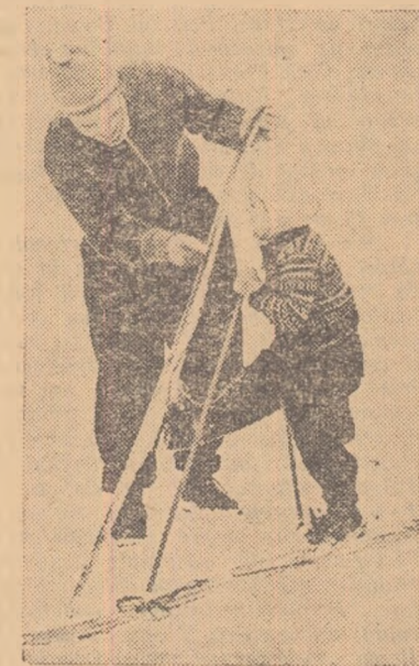
A venit iarna? Nu, dar micuțul schior pe care-l vedeți în fotografie și care a învățat în sezonul trecut primele noțiuni ale mersului pe schi se gîndește poate ce bine ar fi să ningă cît mai curînd

vom sublinia că dacă pentru probele alpine și cele de fond au existat condiții și preocupări, pentru sărituri nu s-a făcut aproape nimic din cauza lipsei trambulinelor. În acest sezon greșeala nu trebuie repetată. Comisiile regionale și antrenorii se pot ocupa încă de pe acum de amenajarea unor trambuline mici (8-12 m), pe care micușii schiori să învețe primele noțiuni ale acestei dificile probe.