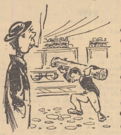
Grăbește-te, Popescule, că sună de intrare... Desen de D. Mihăilă

49 a M.I.C., Secția de învățămînt (nu mai e nevoie să amintim cine e șeful tov. Al. Tărnacop) a dat dispoziție ca elevii de la Școala medie din comuna Drăgănești să lase ballă ora de educație fizică și să dea fuja la gară, să ajute la descărcarea unor vagoane. Firește, elevii din Drăgănești, care au construit terenuri de handbal și volei prin muncă voluntară, sînt gata ori-