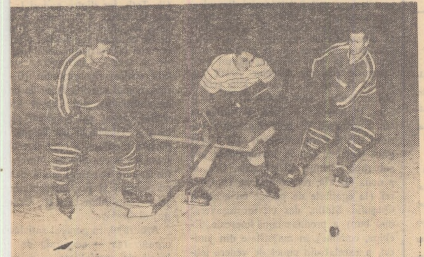
Un aspect din meciul de sîmbătă seara: Ionescu, unul din cei mai buni jucători ai Selecționatelor București, luptă pentru puc flancat de doi adversari