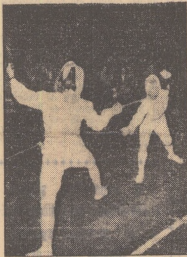
Floretistele au jurnizat întoldeauna întreceri mult disputate, urmărite cu interes de către spectatori. Iată un aspect din finala probei de floretă femei a campionatului republican individual, desfășurat între 15-18 octombrie la București.

Întrecerile au loc în sala de sport de la Stadionul Tineretului (în București) și în sala de gimnastică a uzinelor „Ianoș Herbak” (Cluj), de la ora 8,30 dimineața.