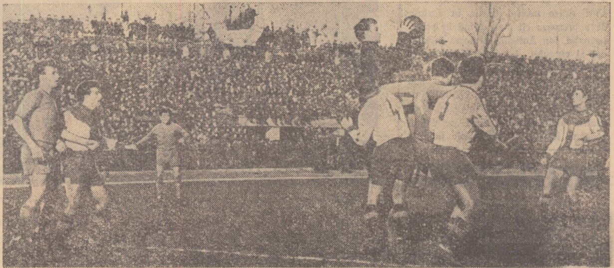
O fază din meciul Dinamo București — Farul Constanța: portarul constănțean reține balonul deasupra unui buchet de jucători.

• C.C.A. învinsă la Cluj, a rămas totuși pe primul loc datorită golaverajului • Echipa Steagul roșu a terminat sezonul neînvinșă • Știința și Jiul performerii etapei • Echipa campioană, Petrolul, a cîștigat greu acasă • Scor net la Bacău