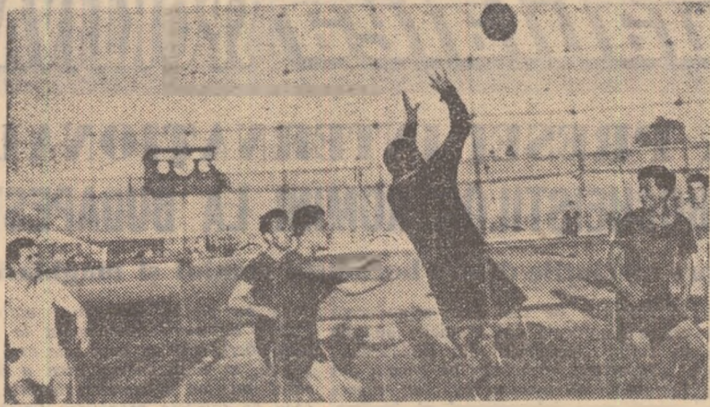
Federația de specialitate acordă o mare importanță depistării elementelor talentate din rândurile tinerilor fotbaliști. În cadrul acestei acțiuni s-au organizat o serie de meciuri interregiuni. Iată o imagine din întilnirea București I—București II, desfășurată la sfârșitul lunii trecute în Capitală. Zilele acestea vom revedea iarăși o parte dintre jucătorii care s-au impus la primele trialuri.