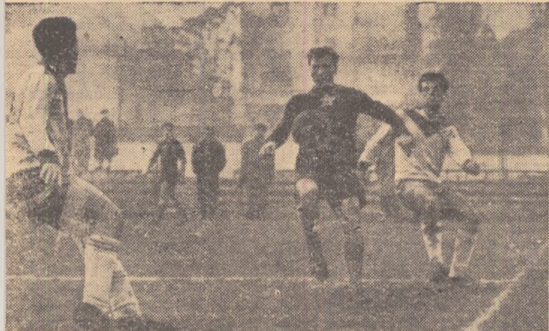
„Imagine de la antrenamentul de joi al echipei C.C.A. Constantinescu (joc) controlează balonul în careul echipei de juniori a Progresului.

— Amănunte și declarații în legătură cu pregătirile echipelor —