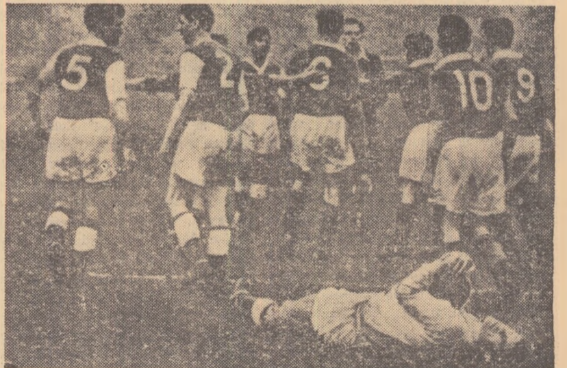
Scenă obișnuită în fotbalul britanic... Un atac al lui Glasgow Rangers la poarta echipei Hibernians... Portarul a rămas întins la pămînt, leșinat. După cum se vede, însă, din fotografie, jucătorii ambelor echipe nu fac prea mare caz de incidentul produs și se reîntorc liniștiți la posturile lor.