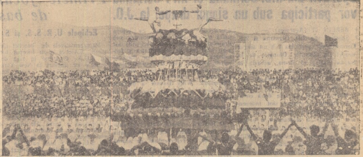
Un aspect de la marea demonstrație a tineretului sportiv albanez cu prilejul primei Spartachiade Naționale

Oamenii muncii din patria noastră urmăresc cu satisfacție și bucurie eforturile poporului frate albanez pentru făurirea unei vieți noi, socialiste. Cu prilejul celei mai mari sărbători naționale, poporul român felicită călduros poporul Albaniei, urându-i noi victorii pe drumul făuririi socialismului.