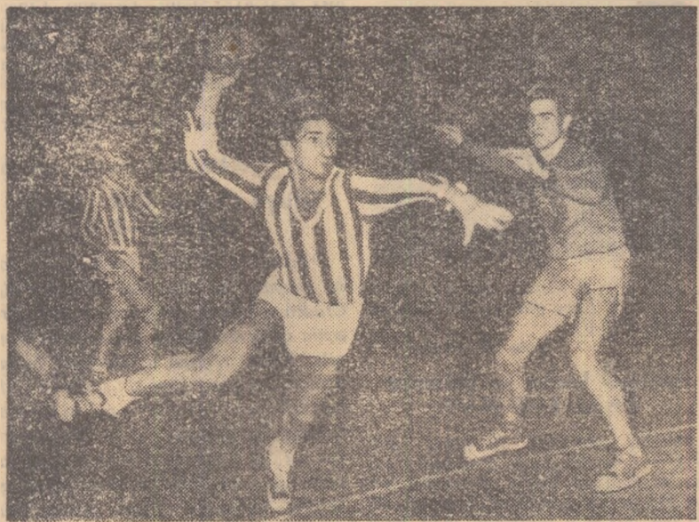
Unul din contraatacurile echipei feroviare a surprins descoperită apărarea echipei C.C.A. care va primi un gol. Fază din meciul Rapid-C.C.A. în care victori a revenit militarelor.