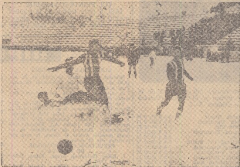
Știrbei intervine la timp la o acțiune întreprinsă de Proca și Iămureșle o situație dificilă în fața porții Progresului. Fază din întâlnirea Progresul — Steagul roșu (4-0).

ARAD, 6 (prin telefon). — Mare riza azi în localitate: echipa din goria B Știința Timișoara a obținut o strălucită victorie asupra Petrolului cu scorul de 5-1 (2-0). Jucării studenților timișoreni este pe deplin meritată, întrucât ei au desfășurat un joc excelent, entuziasmand pe cei 5.000 de spectatori prezenți pe terenul C.F.R. Înaintarea a combinat viteză, creșterea multor faze spectaculoase și dovedind multă eficacitate. Petrolul a fost, de data asta, sub aerea sa obișnuită. Ploieștenii n-au putut să treacă de apărarea impetuoasă a studenților și nici n-au știut să facă excelențe înaintării timișore-