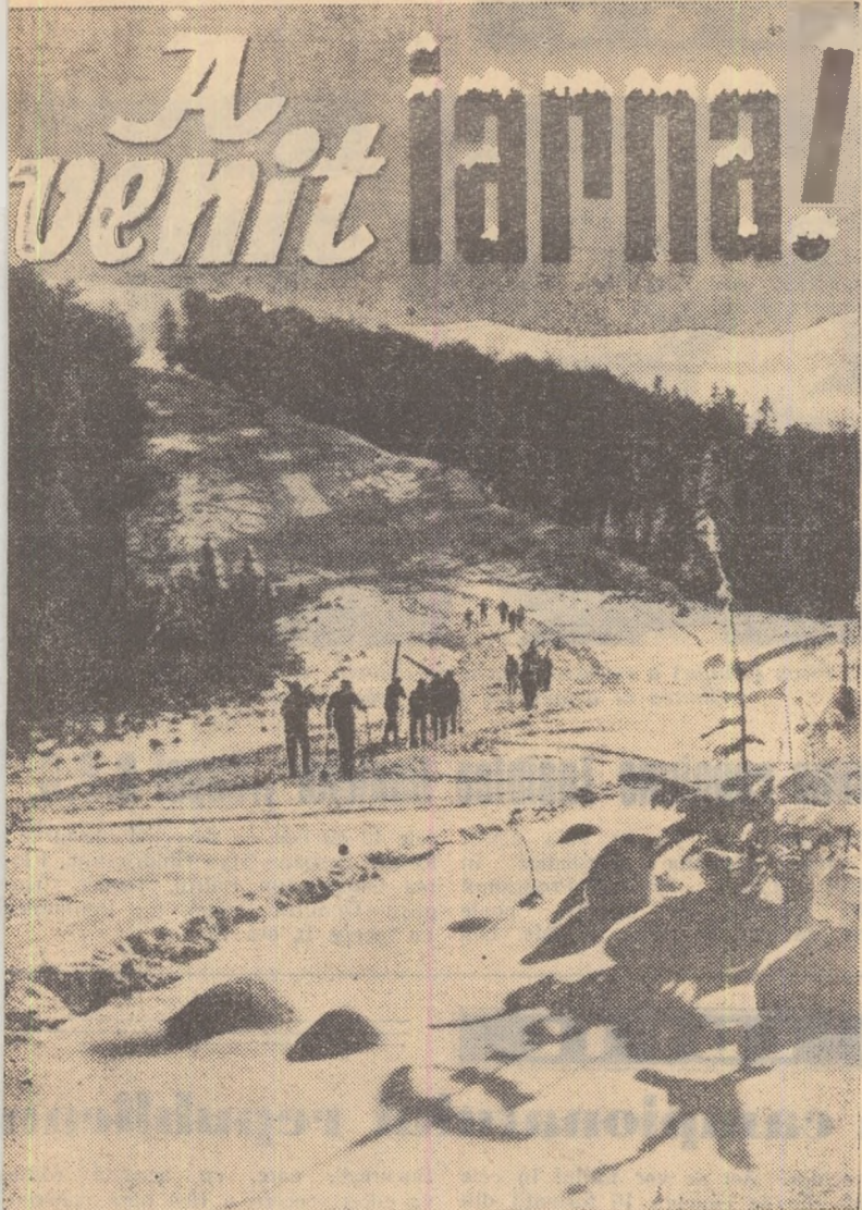
Țibitori ai drumetiei, munții patriei noastre vă așteaptă înveșmîntați în manimaculată a zăpezii. Vă urăm drum bun!