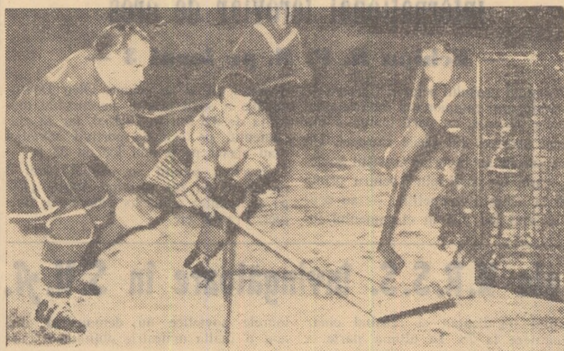
Aspect dintr-o partidă Voința Miercurea Ciuc — Avîntul Miercurea Ciuc