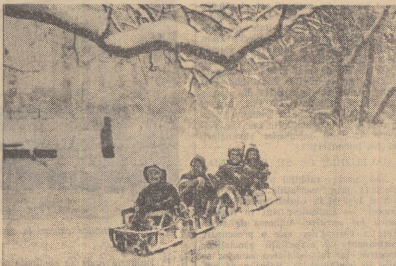
Mai întreprinzători, cei mai mici dintre sportivi au și dat sînuile jos din... pod pentru a inaugura sezonul de iarnă

BALA MARE Comisia regională de schi a luat o serie de importante măsuri pentru pregătirea activității de iarnă. Astfel, de-a lungul pîrtiei Mogoșă, de pe dealul Negru și pînă în valea Sutorului, pe o lungime de 2.400 m. au fost instalați 18 stîlpi susținători ai noului schi-lift, care va înlesni pregătirea schiorilor băimăreni. De asemenea, au fost aduse serioase îmbunătățiri pîrtiilor (pentru întrecerile de schi alpin și probe de fond) de la „Izvoare”,