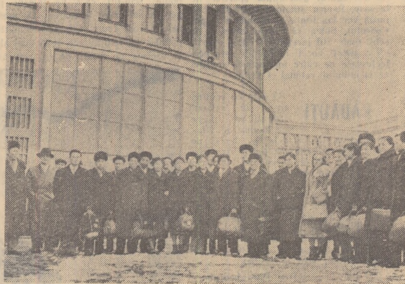
Lotul sportivilor chinezi la sosirea pe aeroportul Băneasa

Sportivii noștri așteaptă cu încredere prima lor confruntare cu gimnaștii din R. P. Chineză. Ei știu că au o sarcină deosebit de dificilă întrucît în ultima vreme oaspeții au progresat foarte mult. Dar și sportivii noștri s-au pregătit bine, cu conștinșiozitate. De aceea, așteptăm de la ei o comportare pe măsura posibilităților și a valorii — recunoscute — a gimnasticii din țara noastră.