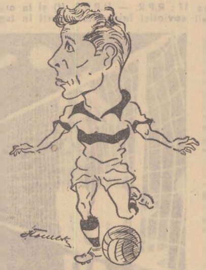
SEVER (Farul). Desen de: P. Stoiculescu

indisciplină (Ciocescu, Toma), neregularități în joc (Ciuncan). Dintr-o greșită îndrumare și dintr-o greșită înțelegere a jocului athletic, jucătorii au alunecat deseori pe panta unui joc în forță, dur, neregularitar. În această direcție trebuie să-și îndrepte atenția antrenorii și în general spre formarea