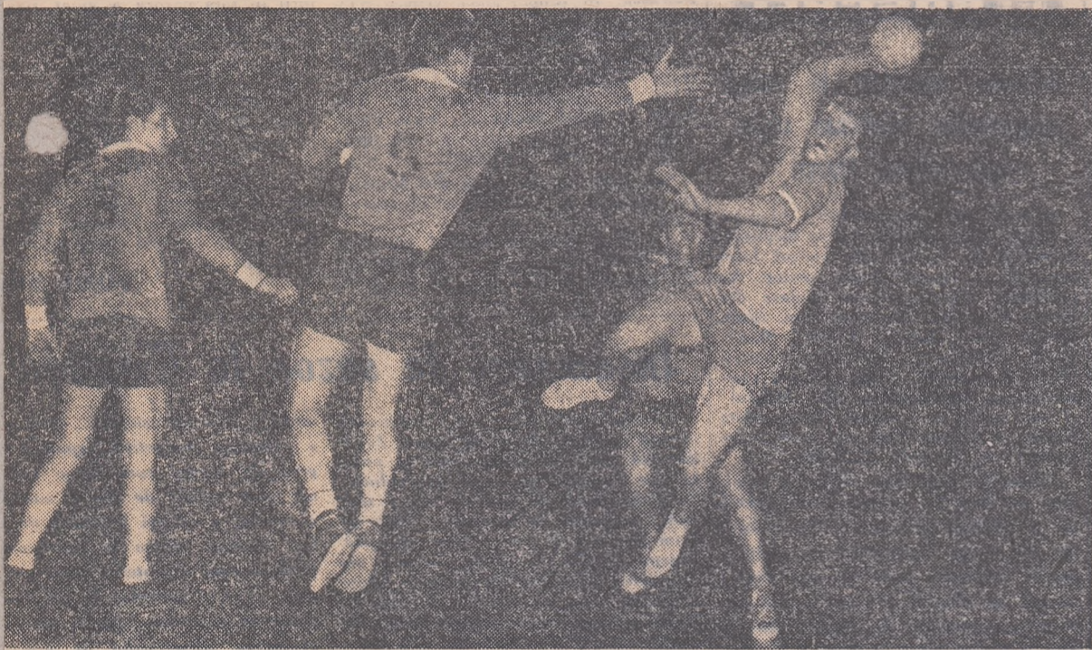
Faza din meciul (masculin) dintre selecționatele Praga și Sarajevo