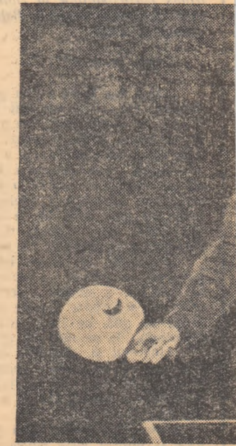
Valorosul jucător Vojislavlor sale deosebite, evoluțiile sale bucureștine.