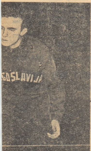
...a făcut din nou dovada calității mării cu mult interes de publicitate.

luna februarie premii suplimentare în valoare de 200.000 lei, printre care și un autoturism. Toate variantele depuse la cele patru concursuri din luna februarie (concursurile nr. 6, 7, 8 și 9) participă deci la tragerea din urnă care va avea loc la sfârșitul lunii februarie. Amănunte detaliate primiți la toate agențiile Loto-Pronosport.