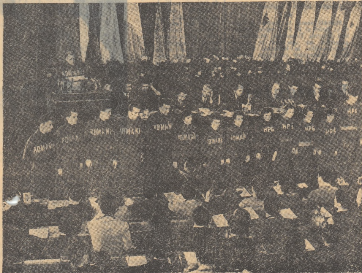
Maestra emerită a sportului Iolanda Balas dă citire salutului sportivilor români adresat Întâlnirii de la București.

ANUL XV — nr. 3556 ★ Luni 1 februarie 1960 ★ 4 pagini 25 bani