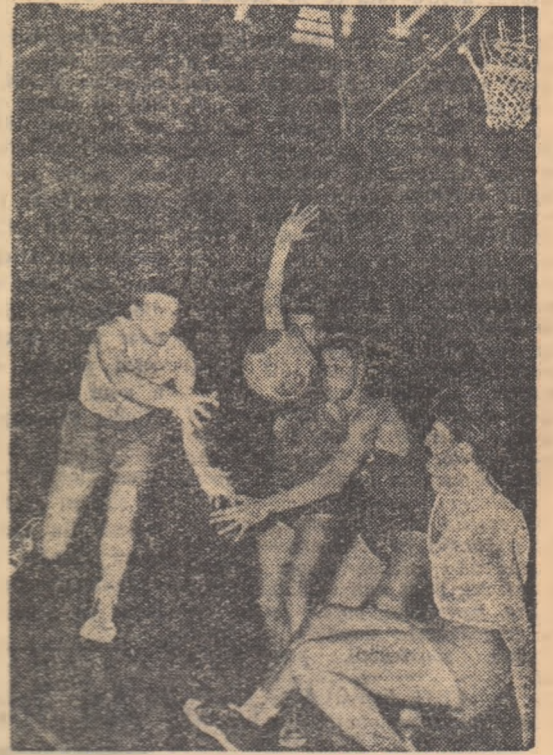
O fază din înfălțura dintre selecționatele de tineret ale R. P. Romine și R. P. Bulgaria care a încheiat turneul internațional de baschet.

R.P. Romine pe cea a R.P. Bulgaria. Formația noastră — victorioasă cu 67—57 (35—36) — a avut de luptat cu o echipă redutabilă, jucătorii bulgari dînd dovadă de același joc energetic, fiind foarte activi atît în apărare cît și în atac și folosind procedee tehnice moderne. Evoluția scorului a fost deosebit de atractivă, avantajul alterînd mai ales în primele 20 minute, de multe ori în favoarea uneia sau alteia dintre echipe: 8—5, 11—14, 26—