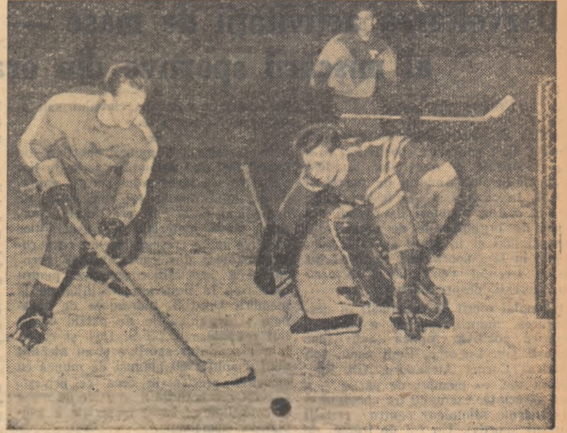
Aspect din întâlnirea amicală de marți dintre Torpedo Gorki și o selecționată bucureșteană: Cozan I atacă poarta oaspeților

Marți seara, spre exemplu, echipa slovacă. Antrenorul Stanek ne-a comunicat că formația din Vitkovice, Ostrava a deplasat un lot de 17 jucători, din echipă lipsind doar portarul Mikulas și atacantul Vlach, selecționați în