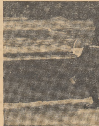
Patinatorul sovietic Evghenii Grișin (în prim plan), campion olimpic și deținător al recordului mondial pe 500 m (40,2 sec) își va apăra la Squaw Valley titlul cucerit cu patru ani în urmă la Cortina d'Ampezzo

SQUAW VALLEY (Agerpres). În localitatea Squaw Valley din S.U.A. se deschide astăzi cea de-a 8-a ediție a Jocurilor Olimpice de iarnă. Inaugurate în anul 1924 la Chamonix, ele s-au desfășurat apoi la Saint Moritz (1928), Lake Placid (1932), Garmisch Partenkirchen (1936), Saint Moritz (1948), Oslo (1952) și Cortina d'Ampezzo (1956). Cu prilejul celei de-a 7-a ediții au participat pentru prima oară la Olimpiada de iarnă, sportivii sovietici, care au obținut atunci un strălucit succes, cucerind cel mai mare număr de medalii de aur și locul întâi în clasamentul neoficial pe națiuni.