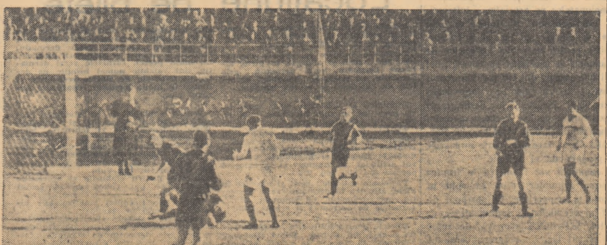
Atac la poarta echipei Lokomotiv Leipzig, în meciul cu Petrolul, Dridea (nr. 9) a ajuns însă prea tîrziu și portarul oaspeților a blocat mingea la pămînt