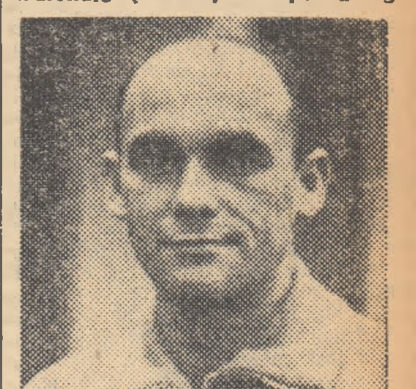
BONE italiană. În cursul zilei de ieri a fost desemnată echipa noastră care va da replica puternicei formații italiene: C.C.A., liderul campionatului categoriei A.

Se știe că la 10 martie va evolua în București cunoscuta echipă Internațională (Milano) din prima ligă