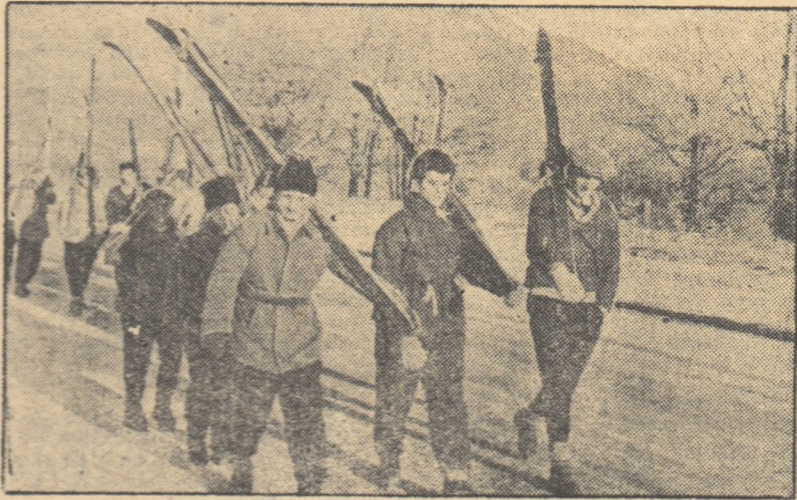
Spartachiada de iarnă a orașului București a angrenat în întreceri un mare număr de sportivi din Capitală. În lipsa zăpezii, mulți dintre schiorii bucureșteni s-au deplasat pe Valea Prahovei. Iată în fotografia noastră un grup de tineri îndreptându-se spre locul de start.

De aceea, pentru toate organele UCFS, pentru comisiile pe ramură de sport și asociațiile sportive o sarcină de frunte este organizarea unei largi activități sportive competiționale pe plan local și această sarcină trebuie să-și găsească rezolvarea cit mai curând. Sezonul sportiv de primăvară care bate la ușă trebuie folosit din plin în această direcție. Muncind cu atenție și răspundere, organele UCFS vor putea astfel aduce o importantă contribuție la dezvoltarea continuă a sportului de masă, la îndeplinirea obiectivelor centrale ale mișcării noastre de cultură fizică și sport pe anul 1960.